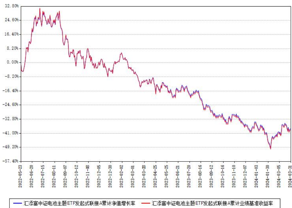
汇添富中证电池主题ETF发起式联接A累计净值增长率与同期业绩基准收益率对比图

(二) 自基金合同生效以来基金累计净值增长率变动及其与同期业绩比较基准收益率变动的比较图