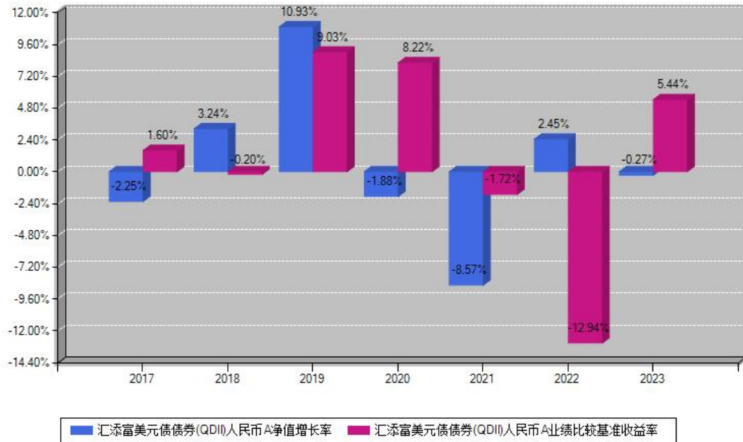
汇添富美元债债券(QDII)人民币A每年净值增长率与同期业绩基准收益率对比图

注：数据截止日期为2023年12月31日，基金的过往业绩不代表未来表现。本《基金合同》生效之日为2017年04月20日，合同生效当年按实际存续期计算，不按整个自然年度进行折算。