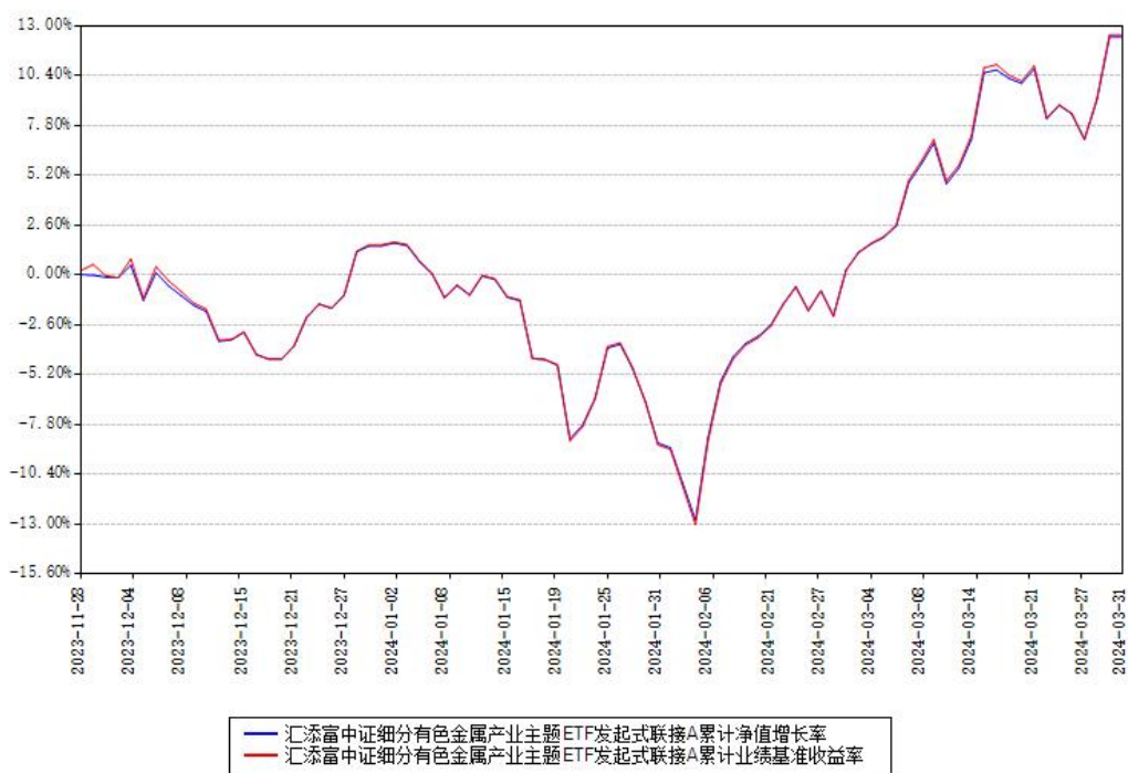
汇添富中证细分有色金属产业主题ETF发起式联接A累计净值增长率与同期业绩基准收益率对比图