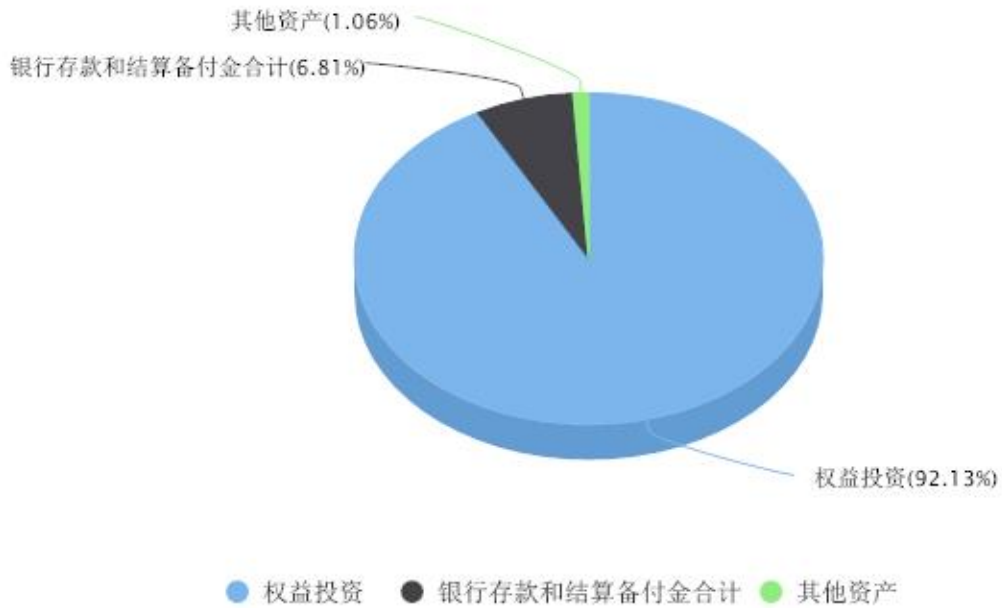
投资组合资产配置图表 数据截止日期:2024年03月31日