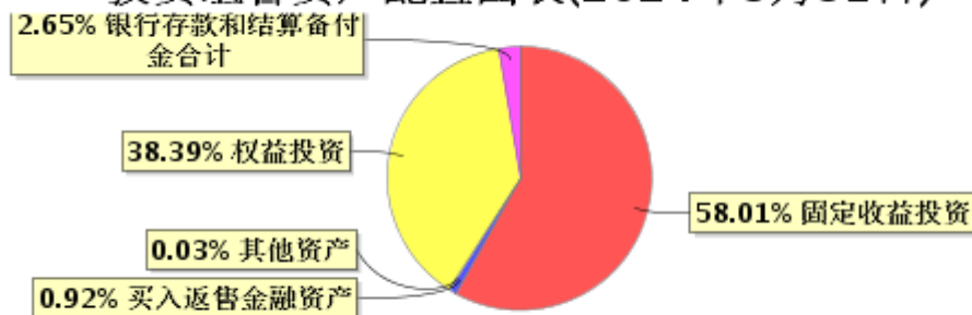
投资组合资产配置图表(2024年3月31日)

● 固定收益投资 ● 买入返售金融资产 ● 其他资产 ● 权益投资 ● 银行存款和结算备付金合计