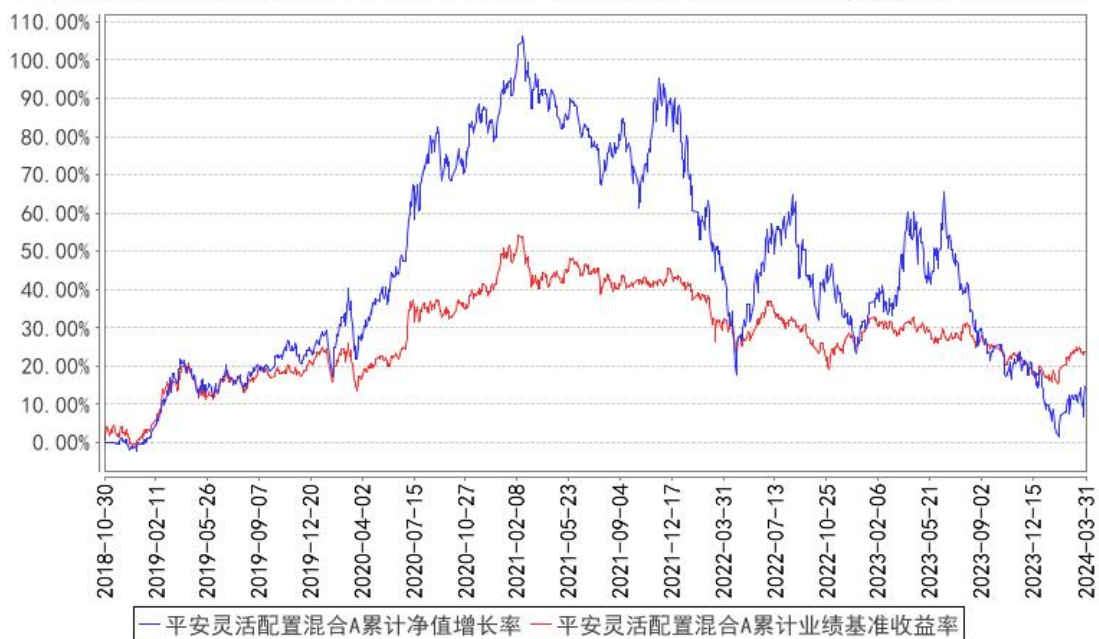
平安灵活配置混合A累计净值增长率与同期业绩比较基准收益率的历史走势对比图