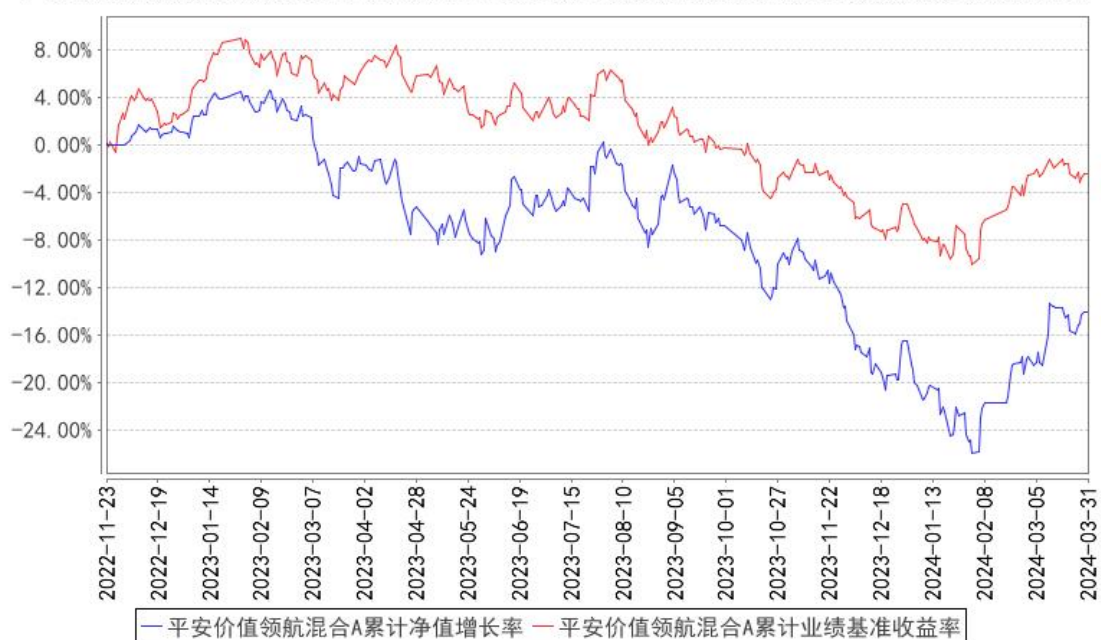
平安价值领航混合A累计净值增长率与同期业绩比较基准收益率的历史走势对比图