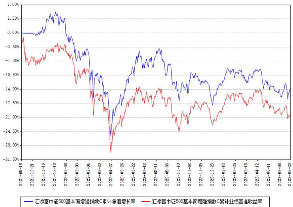
汇添富中证500基本面增强指数C累计净值增长率与同期业绩基准收益率对比图