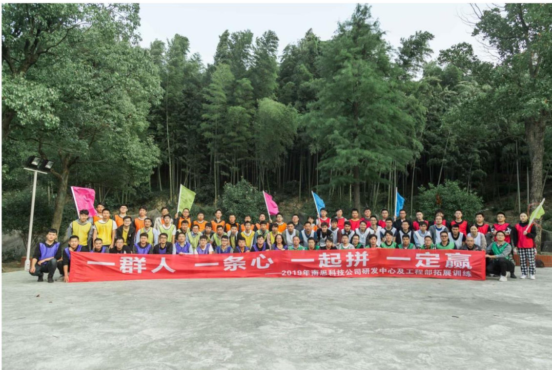
图 6.6 员工培训