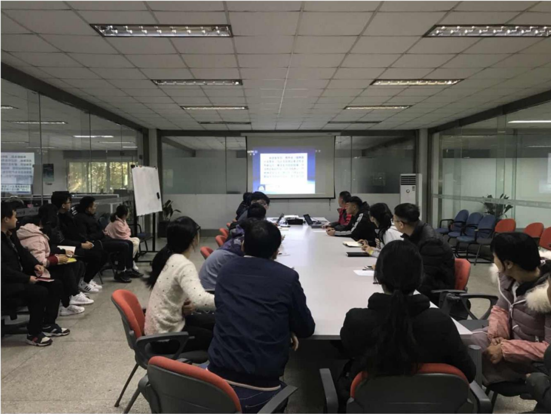
图 6.3 员工培训