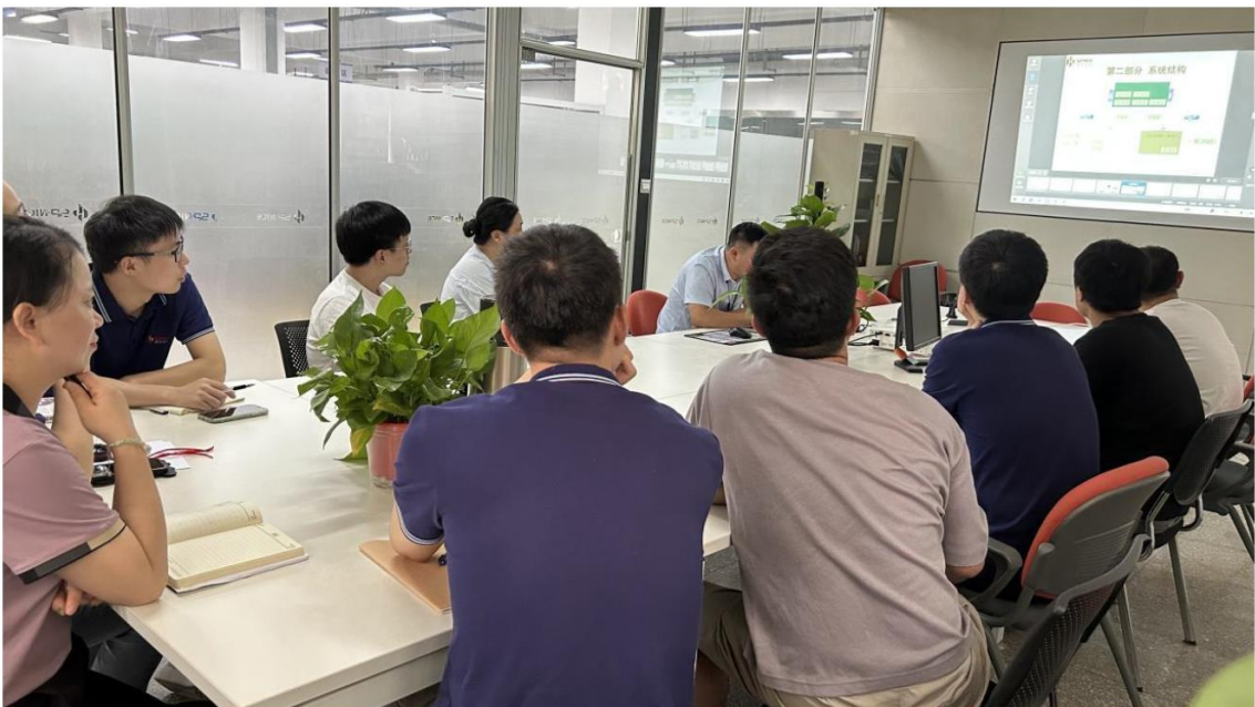
图 6.4 员工培训