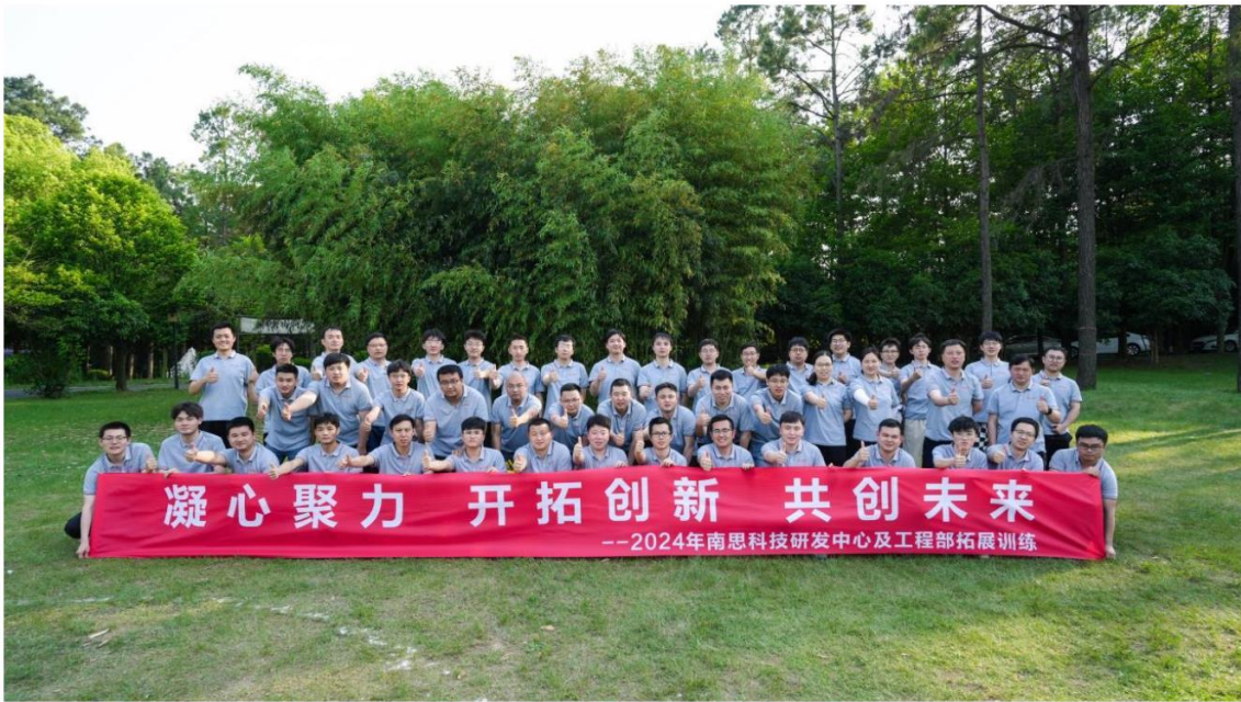
图 6.5 员工培训