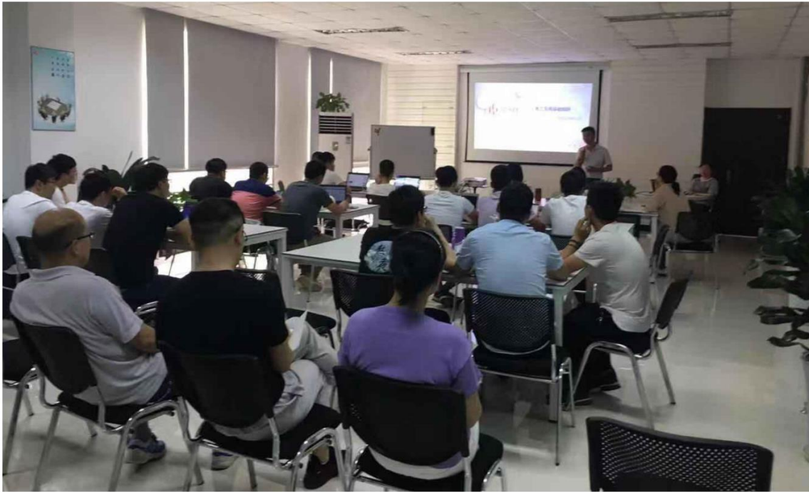
图 6.1 员工培训