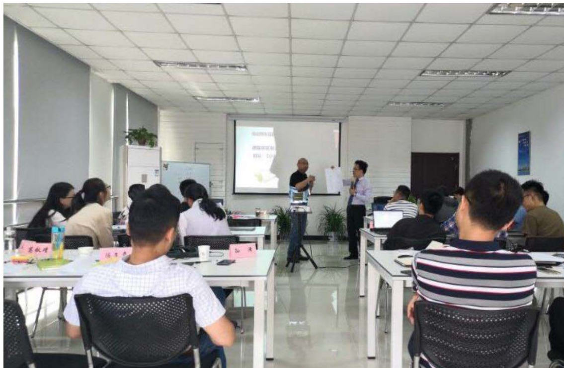
图 6.2 员工培训