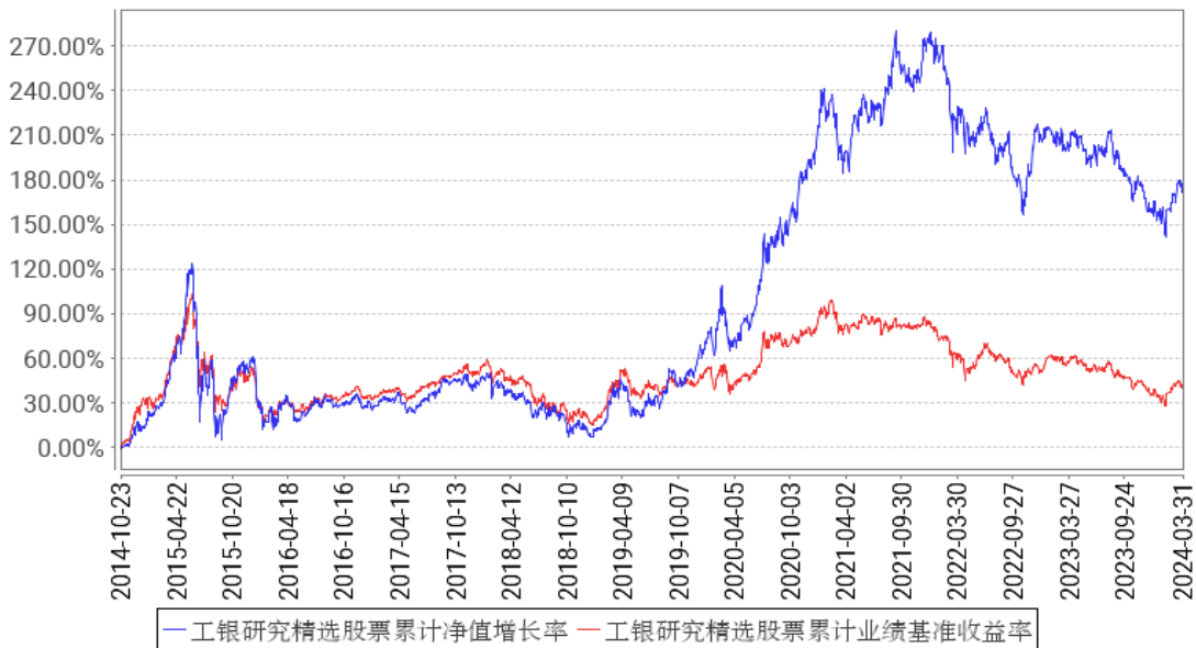
工银研究精选股票累计净值增长率与同期业绩比较基准收益率的历史走势对比图