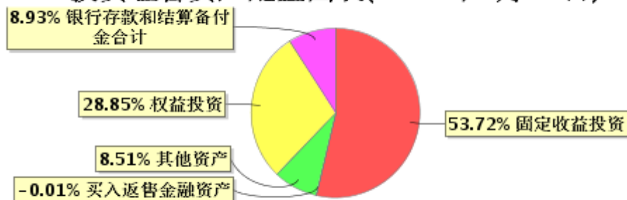
投资组合资产配置图表(2023年9月30日)

● 固定收益投资 ● 买入返售金融资产 ● 其他资产 ● 权益投资 ● 银行存款和结算备付金合计