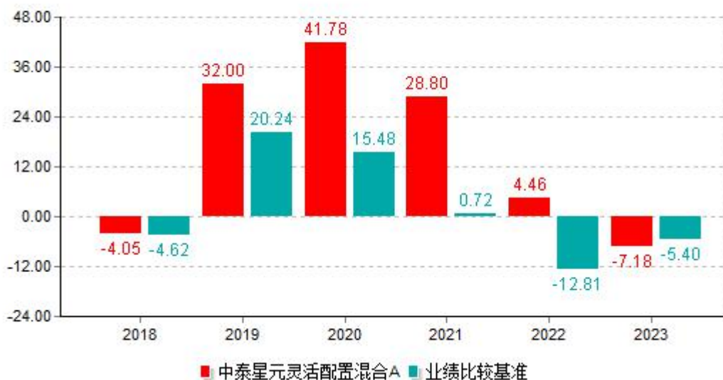
基金的过往业绩不代表未来表现，数据截止日：2023年12月31日 单位%

注：基金合同生效当年不满完整自然年度，按实际期限（2018年12月5日-2018年12月31日）计算净值增长率。