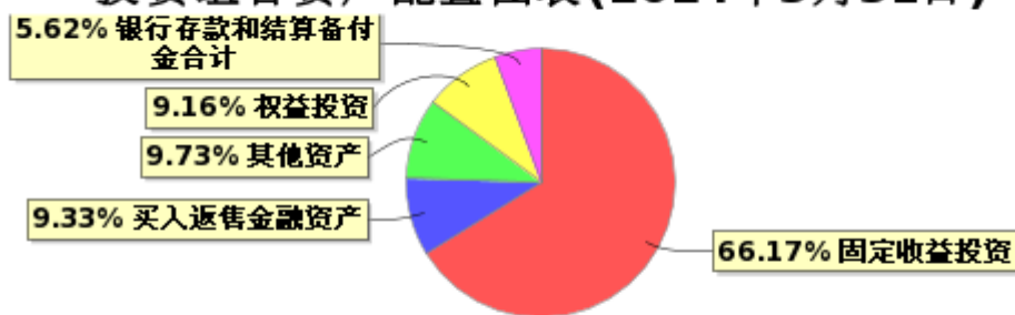
投资组合资产配置图表(2024年3月31日)

● 固定收益投资 ● 买入返售金融资产 ● 其他资产 ● 权益投资 ● 银行存款和结算备付金合计