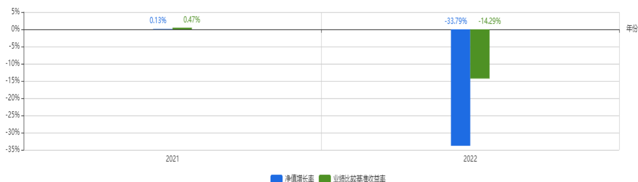
基金每年的净值增长率及与同期业绩比较基准的比较图