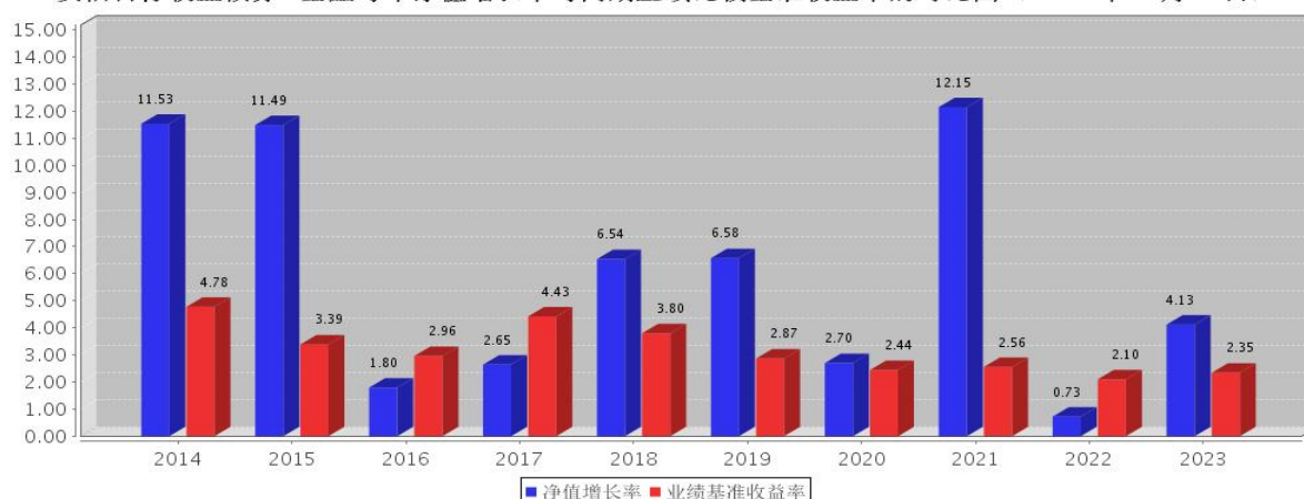
安信目标收益债券A基金每年净值增长率与同期业绩比较基准收益率的对比图（2023年12月31日）

注：基金合同生效当年期间的相关数据按实际存续期计算。基金的过往业绩并不代表其未来表现。