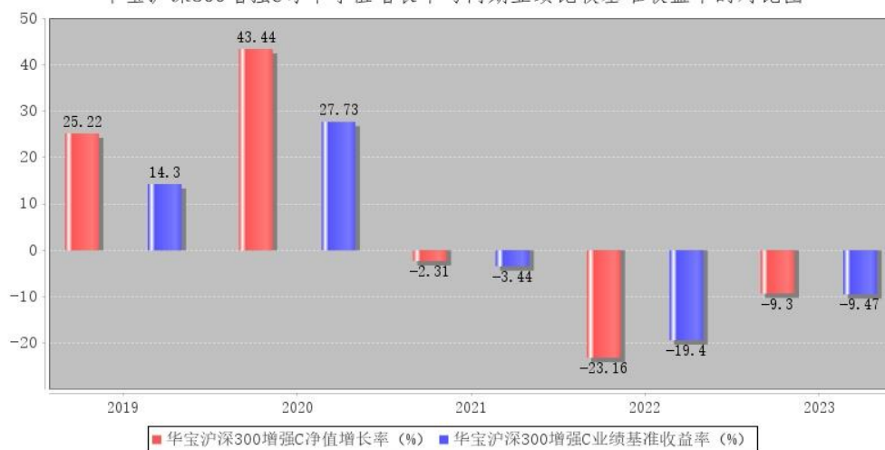
华宝沪深300增强C每年净值增长率与同期业绩比较基准收益率的对比图