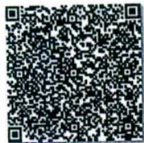
该证书的年检二维码

本证书经检验合格, 继续有效一年。 This certificate is valid for another year after this renewal.