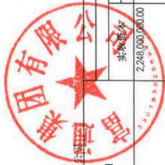
合并所有者权益变动表