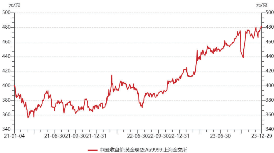
图 2021 年初至 2023 年末黄金价格趋势图

截至 2023 年年底,伦敦金(LBMA)午盘价达到 2,078.4 美元/盎司,创下年末收盘价新高,将黄金投资年回报率推至 15%。2023 年平均金价为 1,940.54 美元/盎司,同样创下历史新高,相比 2022 年上涨了 8%。2023 年,国际黄金价格在高位波动。12 月底,伦敦现货黄金年终价格为 2062.40 美元/盎司,较 2023 年初开盘价 1835.05 美元/盎司上涨 12.39%,年度均价 1940.54 美元/盎司,较上一年 1800.09 美元/盎司上涨 7.80%。上海黄金交易所 Au9999 黄金 12 月底收盘价 479.59 元/克,较 2023 年初开盘价上涨 16.69%,全年加权平均价格为 449.05 元/克,较上一年上涨 14.97%。