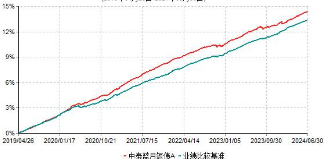
中泰蓝月短债A累计净值增长率与业绩比较基准收益率历史走势对比图 (2019年04月26日-2024年06月30日)