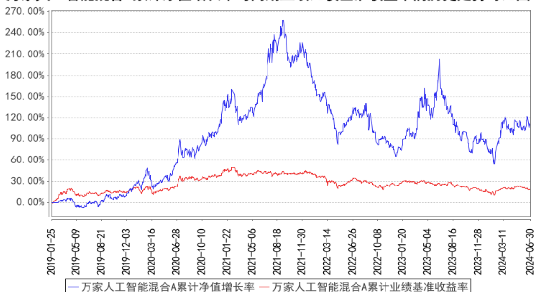
万家人工智能混合A累计净值增长率与同期业绩比较基准收益率的历史走势对比图