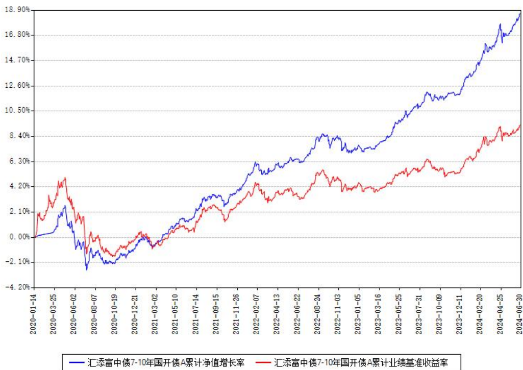
汇添富中债7-10年国开债A累计净值增长率与同期业绩基准收益率对比图