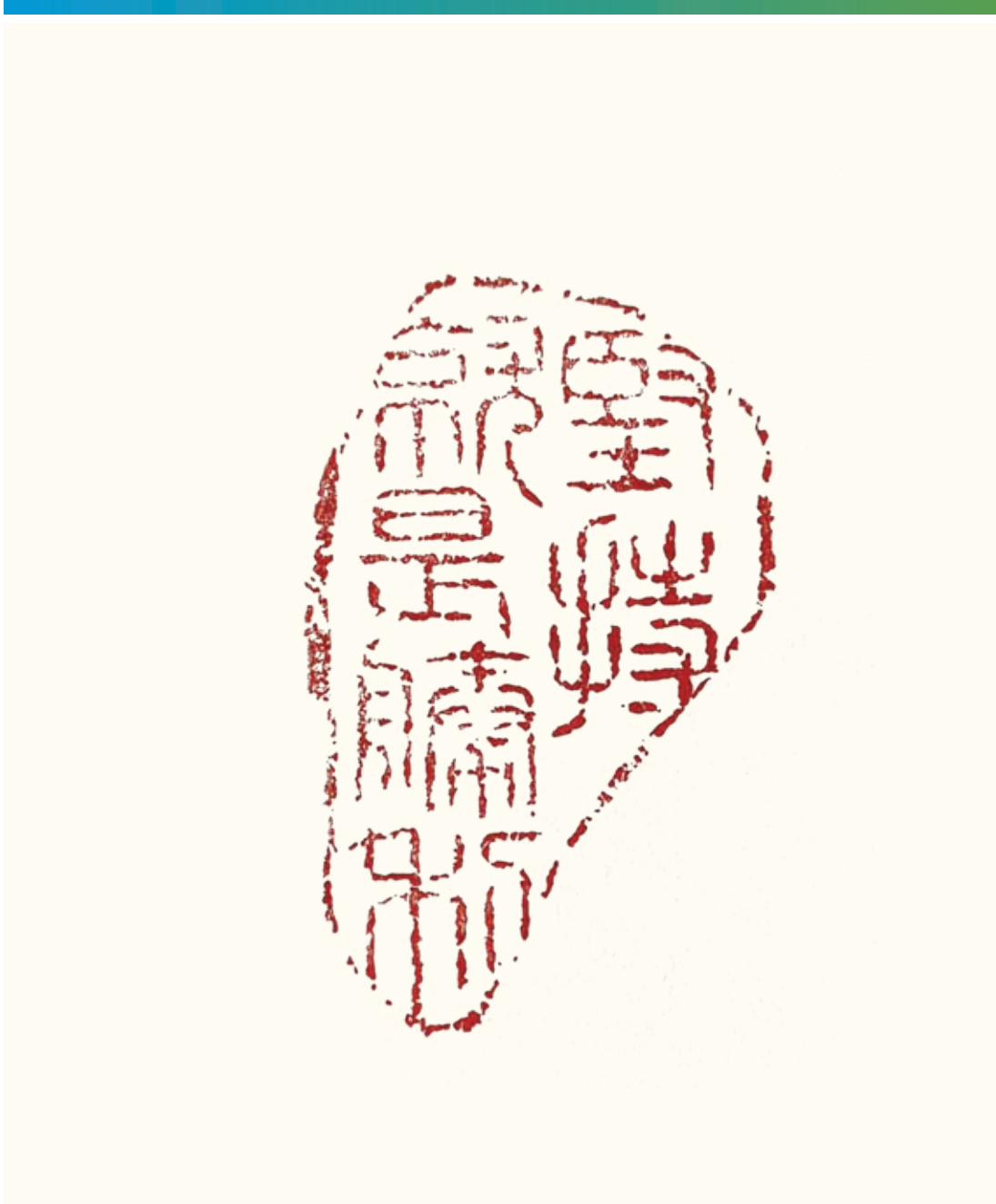
Precious Stone Engraving in Old Chinese Characters "Perseverance is Road to Triumph" Tribute to the 75th Anniversary of the Establishment of The People's Republic of China