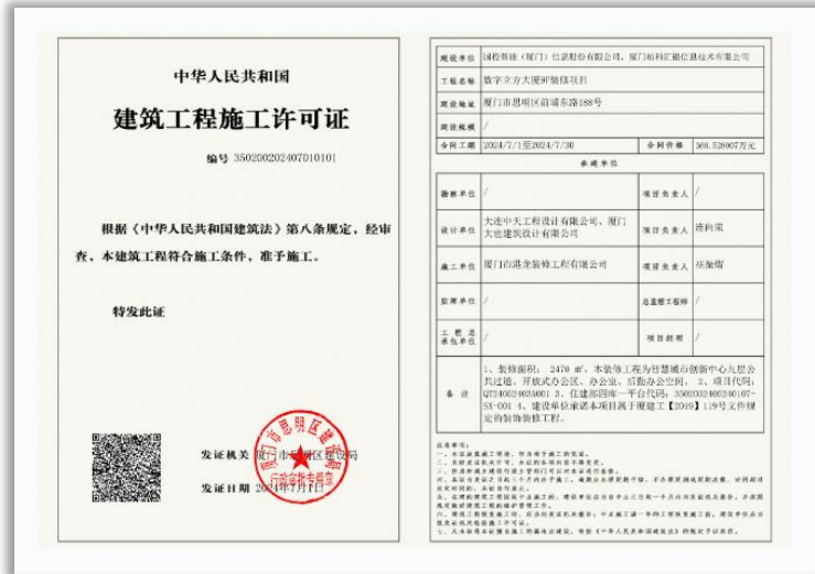
图二：9楼建筑工程施工许可证