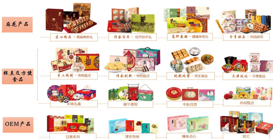
公司自有品牌产品图示

公司自产产品所需原材料主要为面、油、糖、包装材料等，向多家长期合作的供应商直接采购。公司销售模式有两种：一是通过直营店、线上自营店铺直接销售给终端消费者的直销模式；二是通过经销商、商超等流通渠道进行销售的经销模式，个别经销商采用代销模式。公司及涉及食品销售业务的各子公司、直营店均在设立时办理取得相关食品经营许可证，并按期更新，截至报告期末取得的许可证具体情况：