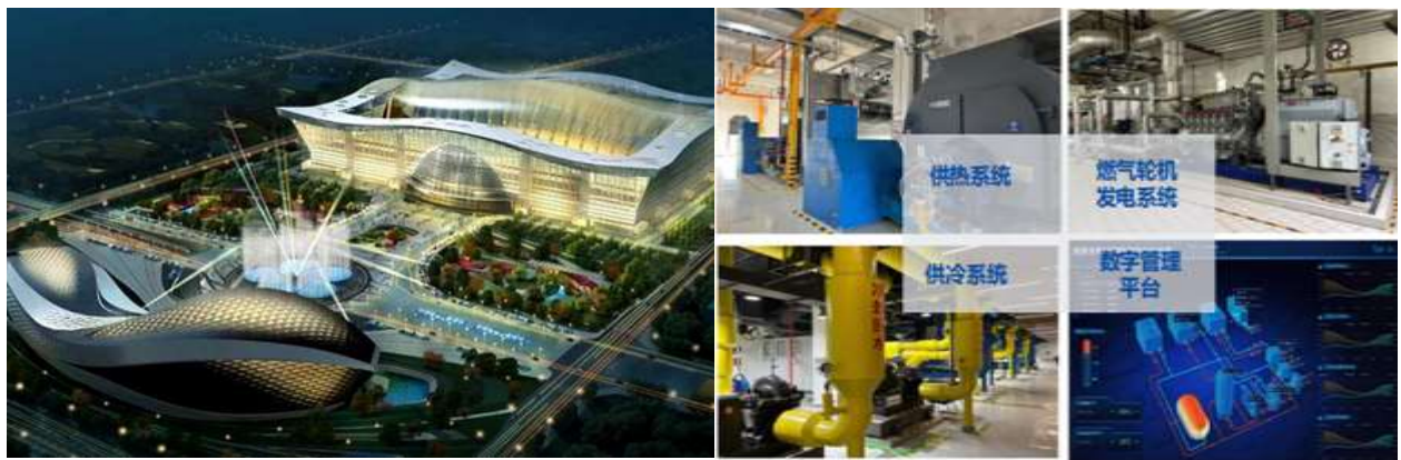
图 5：成都世纪新能源天然气冷热电三联供分布式能源项目

截至 2024 年 6 月 30 日，公司投资及运营项目共 15 个。公司主要运营项目有成都世纪新能源天然气冷热电三联供分布式能源项目；梅州生物质集中供热项目；板桥生物质综合化集中供热项目等核心项目。