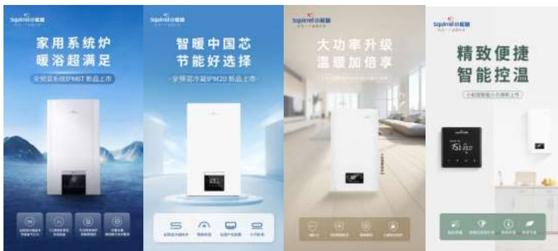
图 7：“小松鼠”壁挂炉新品

小松鼠全预混冷凝炉采用行业领先的“全预混燃烧技术”和“冷凝技术”，通过全预混比例调节方式将空气和燃气充分配比后燃烧，冷却高温烟气，回收利用水蒸气凝结成液态水时释放的热量，实现完全燃烧，相比常规壁挂炉，冷凝式壁挂炉具有热效率高、节能环保和使用寿命长等优势。该产品荣获 CGAC 燃气器具五星级认证，热效率高达 108%，还搭载了三维净化技术（净化空气、净化燃气、净化水质）、宽频调节技术，燃烧功率低至 4.8KW。此外，迪森家居通过工业互联网技术自主研发的智能控制系统，融入了先进的互联网云计算、大数据等技术，创新融合智能舒适家居产品生态体系。它可以通过自动采集室内环境中的温度、湿度、新风量、洁净度、水温等数据，实时反馈数据信息，实现远程控制。同时还能通过收集和分析用户行为数据、室内环境等信息进行自我学习，提供个性化舒适度解决方案。