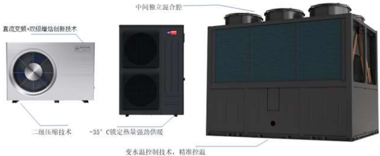
图 8：空气源热泵系列产品