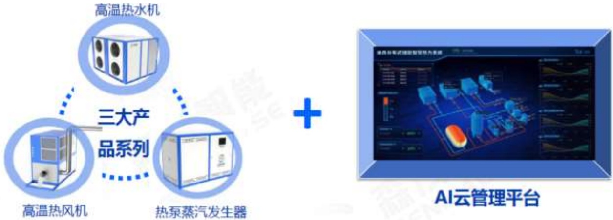
图 2：高温热泵系列产品

迪森装备紧跟数字化和智能化的时代潮流，不断注入智能的基因，打造了物联网运营平台（智能云监测系统），结合了物联网、云计算、传感器、自动控制等技术，构建了一个强大且灵活的设备管理系统，能够在电脑或手机客户端实时显示所有互联网设备的实时运行情况，随时随地掌握设备动态，同时通过大数据分析技术，对横向与纵向数据进行深度挖掘与智能分析，为设备运维、售后服务、设备升级、故障告警、故障排除等方面提供坚实的数据支撑与决策依据。可实现自动化数据采集、分析设备状态、监督现场操作、维修保养预警等服务，为不同需求的客户定制更智能、更节能、更环保的一体化热能解决方案。