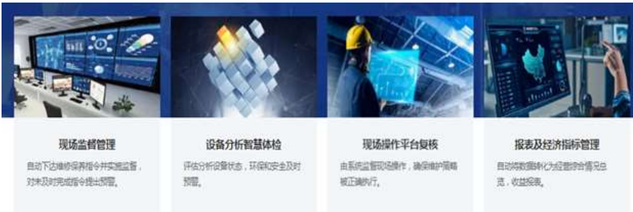
图 3：智能云监测系统

迪森装备紧跟数字化和智能化的时代潮流，不断注入智能的基因，打造了物联网运营平台（智能云监测系统），结合了物联网、云计算、传感器、自动控制等技术，构建了一个强大且灵活的设备管理系统，能够在电脑或手机客户端实时显示所有互联网设备的实时运行情况，随时随地掌握设备动态，同时通过大数据分析技术，对横向与纵向数据进行深度挖掘与智能分析，为设备运维、售后服务、设备升级、故障告警、故障排除等方面提供坚实的数据支撑与决策依据。可实现自动化数据采集、分析设备状态、监督现场操作、维修保养预警等服务，为不同需求的客户定制更智能、更节能、更环保的一体化热能解决方案。