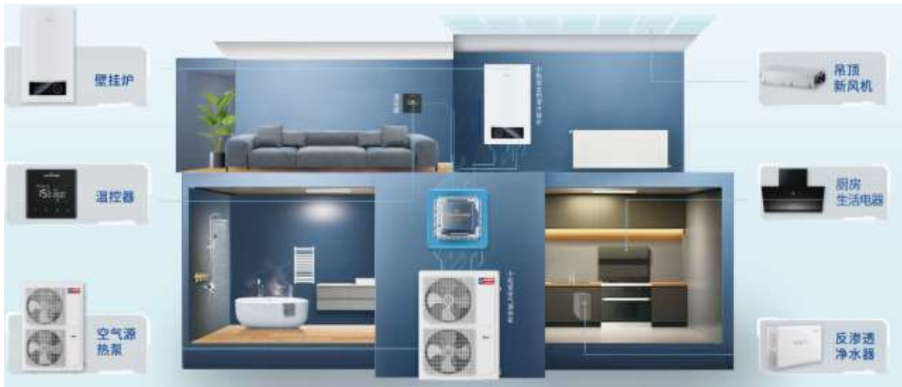
图 6：舒适家居整体解决方案

小松鼠全预混冷凝炉采用行业领先的“全预混燃烧技术”和“冷凝技术”，通过全预混比例调节方式将空气和燃气充分配比后燃烧，冷却高温烟气，回收利用水蒸气凝结成液态水时释放的热量，实现完全燃烧，相比常规壁挂炉，冷凝式壁挂炉具有热效率高、节能环保和使用寿命长等优势。该产品荣获 CGAC 燃气器具五星级认证，热效率高达 108%，还搭载了三维净化技术（净化空气、净化燃气、净化水质）、宽频调节技术，燃烧功率低至 4.8KW。此外，迪森家居通过工业互联网技术自主研发的智能控制系统，融入了先进的互联网云计算、大数据等技术，创新融合智能舒适家居产品生态体系。它可以通过自动采集室内环境中的温度、湿度、新风量、洁净度、水温等数据，实时反馈数据信息，实现远程控制。同时还能通过收集和分析用户行为数据、室内环境等信息进行自我学习，提供个性化舒适度解决方案。