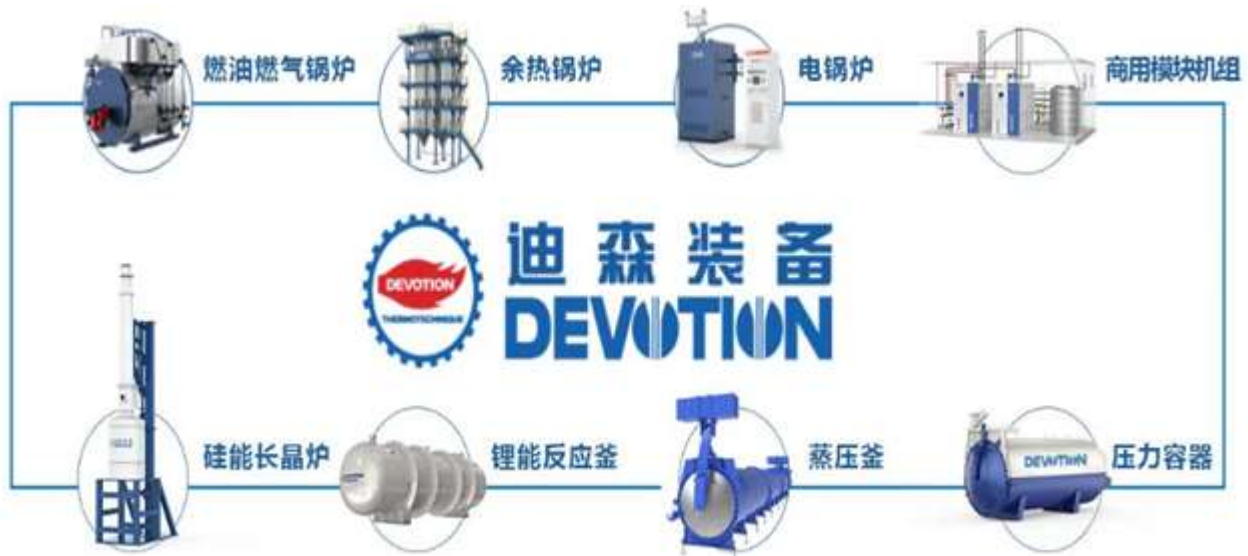
图 1：新能源及清洁能源装备系列产品

公司专注新能源及清洁能源应用装备的研发和制造，实行“以销定产”的经营模式，紧密贴合市场需求，为客户提供新能源装备、热力、蒸汽、采暖等多样化能源装备综合解决方案，构建清洁低碳的绿色服务体系。其中新能源装备产品线丰富，包括光伏设备结构件（单晶炉腔体、多晶炉腔体、蓝宝石炉腔体及铸锭炉腔体等）、锂电池设备、电解水制氢设备（氢氧分离装置）；清洁能源装备主要产品有釜类容器产品系列（如蒸压釜、玻璃蒸压、热压罐、渔网釜）及锅炉产品系列（如电锅炉、余热锅炉、生物质锅炉、商用锅炉、天然气锅炉、热水锅炉）等，这些产品不仅满足了市场的多元化需求，更凭借其卓越的性能赢得了客户的广泛认可。公司拥有机器人焊接生产线，全面实现数字化下料、自动化焊接、标准化装配、数控精加工等智能制造工艺，保证生产效率和产品质量。公司具有深厚技术底蕴，拥有省市两级技术中心和热能工程技术研发中心，是《燃气采暖热水炉》、《电加热锅炉技术条件》、《蒸压釜》等多项国家及行业标准主编单位。全新设计的冷凝锅炉系列产品，可满足国家最新能效标准，最严苛超低氮排放要求，契合中国城镇化及燃气化进程的需求，高效的分布式供热趋势及日益严格的环保标准，已广泛应用于钢铁、化工、汽车、纺织、食品、医药、酒店、学校、住宅、商业综合体蒸汽、采暖和热水供应，定制化的整套供热解决方案，充分满足用户多样性、个性化需求。公司提供专业的售前指导，一对一针对性设计，以及项目运作、设备采购、安装、运营管理等一站式服务，全方位帮助客户发现、识别并解决供热系统的各类问题，保障系统长期稳定运行。