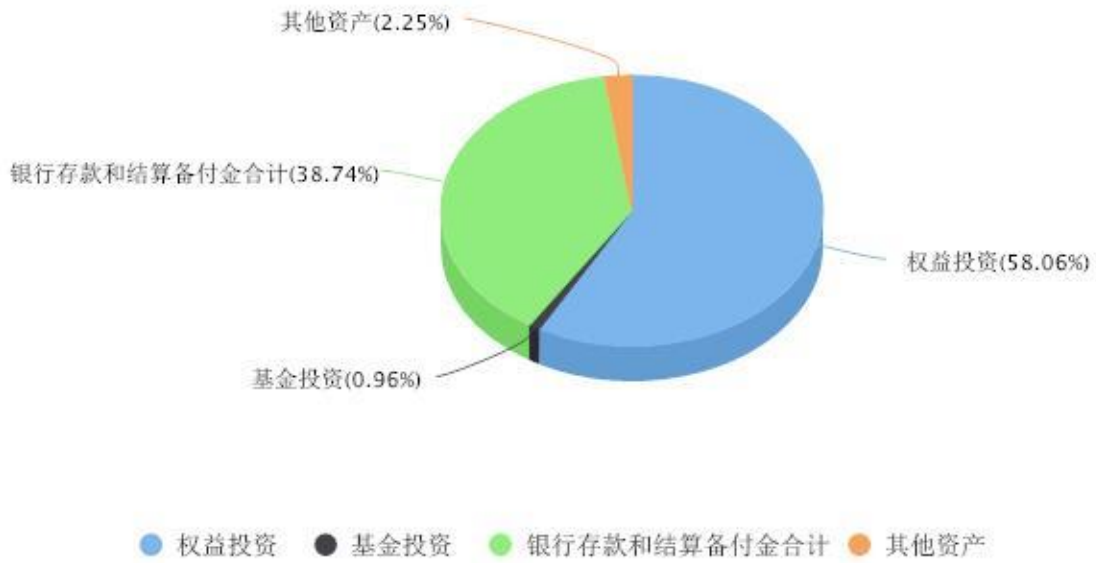
区域配置图表 数据截止日期:2024年06月30日