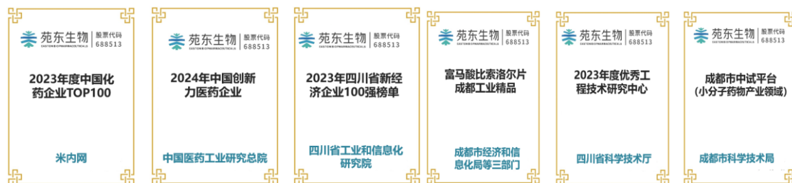
图 3 2024 年度新获得的部分荣誉展示

公司是国家高新技术企业，拥有“国家企业技术中心”、“博士后科研工作站”、“四川省固态药物工程技术研究中心”等多个创新平台，先后获得“国家技术创新示范企业”和“国家绿色工厂”等称号，继 2022 年后公司“药物固态工程技术研究中心”凭借多项药物绿色制造关键技术及产业化蝉联四川省优秀工程技术研究中心的殊荣，自 2018 年以来已连续 6 年登榜“中国化药企业 TOP100”。同时，公司还获得“2022 中国医药创新企业 100 强”、“2022-2023 年度中国医药自主创新先锋企业 50 强”、“2022 年度国家知识产权示范企业”、“中国医药行业 2022 年度质量匠星企业”、“2022 中国药品研发综合实力 TOP100 排行榜”、“2022 中国化药研发实力 TOP100 排行榜”、“2023 年度中国医药研发产品线最佳工业企业”榜单、“四川省制造业‘贡嘎培优’企业”、“四川省技术创新示范企业（青木制药）”、“2023 年四川省新经济企业 100 强榜单”、“2023 年成都民营企业 100 强榜单”、“2024 年中国创新力医药企业”榜单等众多荣誉。