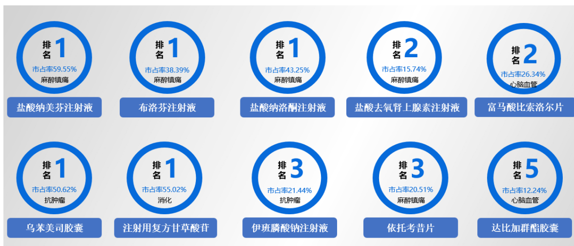
图 2 主要产品市场占有率图例

公司产品聚焦麻醉镇痛、心脑血管、抗肿瘤等五大重点领域。公司是国家定点精神药品生产基地，在麻醉镇痛领域围绕不同临床适应症、疼痛等级、作用机制等布局了丰富的、有竞争力的产品管线，截止本报告日，公司已上市麻醉镇痛及相关领域产品 15 个，在研 20 余个。米内网全国重点省市公立医院数据库 2024Q1 数据显示，公司已上市产品具有较强的市场竞争力，麻醉镇痛及相关领域多个产品市场占有率名列前茅。具体如下：