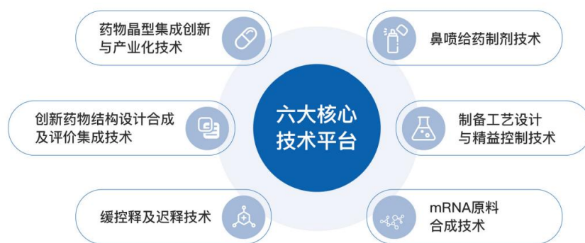
图 4 公司六大核心技术

公司依托持续的技术创新，已逐步建立起国内领先、符合国际标准的研发技术及产业化平台，建立了药物晶型技术平台、缓控释技术平台、特药技术平台、创新药技术平台、鼻喷雾剂技术平台等关键技术平台，已形成药物晶型集成创新与产业化技术、创新药物结构设计合成及评价集成技术、缓控释及迟释技术、鼻喷给药制剂技术、制备工艺设计与精益控制技术、mRNA原料合成技术等 6 大类核心技术。