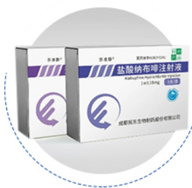
盐酸纳布啡注射液