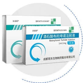
酒石酸布托啡诺注射液

截至本报告日，已实现52个高端化学药品的产业化，其中，7个国内首仿产品；42个通过/视同通过一致性评价的产品，其中，11个为首家通过。