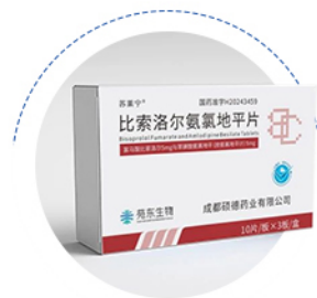
比索洛尔氨氯地平片