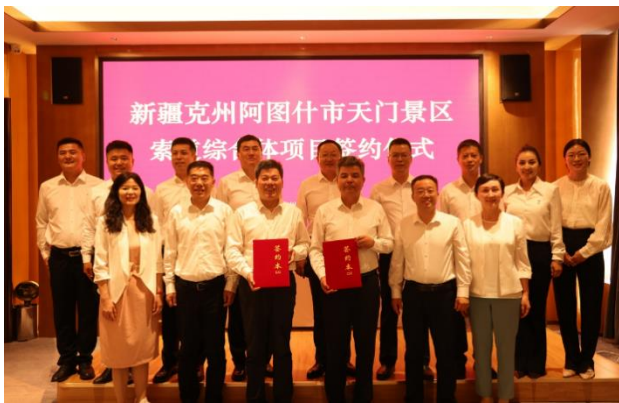
北起院新疆阿图什天门索道投建营项目签约仪式