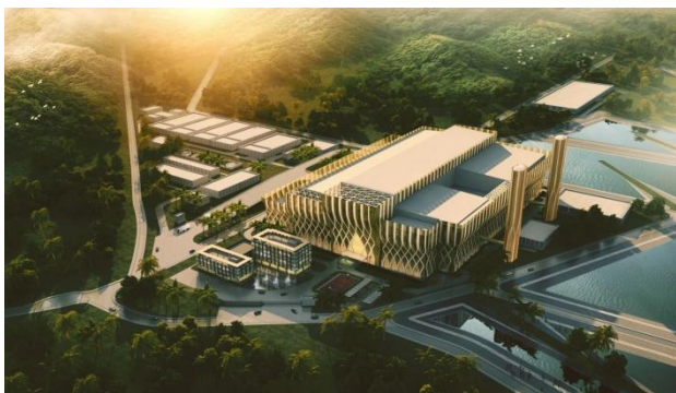
与天楹环保能源集团打包签订7个越南起重运输项目

索道业务板块 ，签约延边帽儿山脱挂索道、新疆白石峰脱挂索道、湖北麻城龟峰山脱挂索道、湖北甘露山文旅城脱挂索道、河南老君山中鼎脱挂索道等重点项目；截止 7 月末，公司已在全国建成 130 条脱挂索道。 物流仓储板块 成功斩获北方华锦石化立体库、比亚迪武鸣弗迪电池原材料库、良信电器（海盐）物流中心二期等智能仓储工程。 起重运输板块 ，签署巴西圣保罗巴鲁埃里垃圾焚烧发电项目、孟加拉国北达卡拉垃圾焚烧发电项目，实现海外市场相继落地；与天楹环保能源集团一次性打包签订 7 个越南项目，展现了公司起重板块业务在环保领域的突出实力。 环保水处理装备板块 ，所属江南环境发挥技术和装备制造优势，为中工国际哈萨克斯坦江布尔州年产 50 万吨纯碱厂项目、乌兹别克斯坦奥林匹城项目提供水处理系统设备供货，签署尼日利亚阿布贾燃机等项目水处理系统，并中标安徽英毅热电精处理冷凝水系统项目；完成内蒙古灵圣废水零排放项目、广西来宾化学水处理系统 EPC 项目竣工移交。