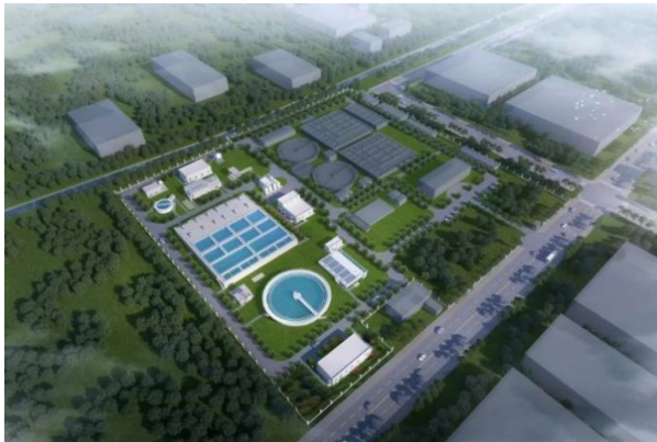
邳州城北污水处理厂三期BOT项目