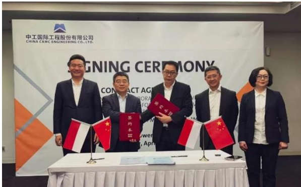
印尼新首都政府公务员住宅项目签约仪式

报告期内，中工国际深耕“一带一路”沿线，顺利签约中白工业园中心区工程交通基础设施建设（一期）项目、老挝 16GW 切片项目土建和钢结构工程项目、印尼新首都政府公务员住宅项目和尼加拉瓜国家应急响应系统项目等多个项目，进一步夯实中工国际国际工程承包主力军的地位。公司签约的哈萨克斯坦江布尔州年产 50 万吨纯碱厂项目已生效，正在进行首批施工图转化，现场正在进行单体基础混凝土浇筑、单体基坑开挖等工作。