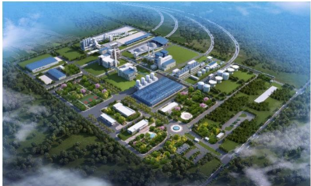
哈萨克斯坦江布尔州年产50万吨纯碱厂项目效果图