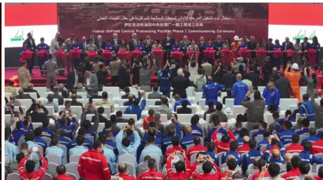
伊拉克九区原油中央处理设施项目顺利投产及达产10万桶产能庆典仪式

乌兹别克斯坦奥林匹克城项目正在进行各场馆内墙、看台装饰装修，管网施工、大平台施工等工作。土耳其图兹湖地下储气库扩建项目完成压缩机平台钢结构安装，正在进行地上、地下管道安装及仪表穿线管安装等工作。印尼杰那拉塔大坝建设项目正在进行初步设计、现场临建施工和料场勘察工作。圭亚那地区医院群项目各地块进行电气预埋管和给排水预埋管的施工，部分地块开始室内消防管道施工。孟加拉 DESWSP 输水管线项目正在进行管线和管道安装工作。喀麦隆隆潘