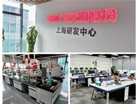
▲ 上图为：2024年4月公司上海研发中心投入使用；