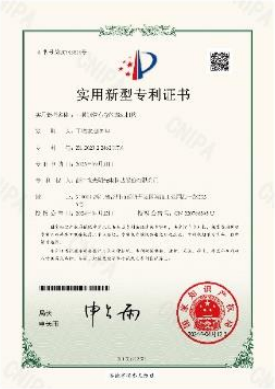
▲ 上图为：2024年04月12日，公司获得一种钢管布卷的搬运结构的实用新型专利授权，专利号：第20743614号；