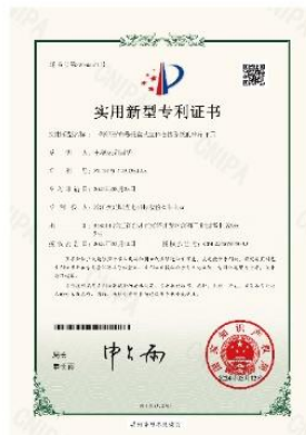
▲ 上图为：2024年03月12日，公司获得一种钢管布卷托盘式立体仓储系统的出库单元的实用新型专利授权，专利号：第20559571号；