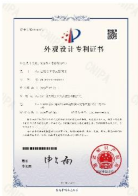
▲ 上图为：2024年02月13日，公司获得反光条（菱形花纹型）的外观设计专利授权，专利号：第8494535号；