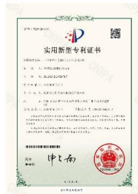
▲ 上图为：2024年04月09日，公司获得一种钢管布卷悬挂式立体库仓储结构的实用新型专利授权，专利号：第20722090号；