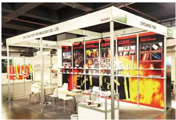
▲ 上图为：2024年05月02日-04日，夜光明参加土耳其劳保展会；