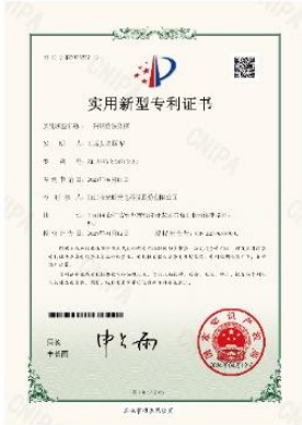
▲ 上图为：2024年04月12日，公司获得一种钢管收集框的实用新型专利授权，专利号：第20752571号；