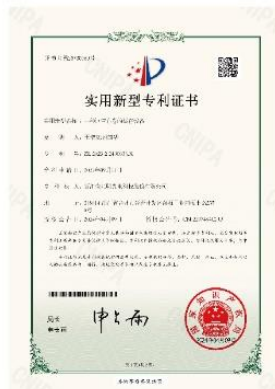
▲ 上图为：2024年04月09日，公司获得一种钢管布卷的储存设备的实用新型专利授权，专利号：第20730589号；