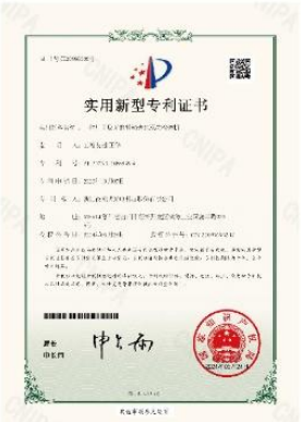
▲ 上图为：2024年05月24日，公司获得一种用于反光面料输送的双层输送机的实用新型专利授权，专利号：第20995330号；