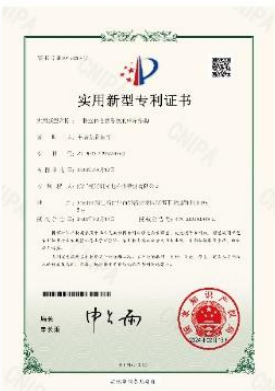
▲ 上图为：2024年02月13日，公司获得一种立体仓储系统的出库结构的实用新型专利授权，专利号：第20473258号；