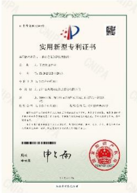
▲ 上图为：2024年04月12日，公司获得一种布卷的钢管收集结构的实用新型专利授权，专利号：第20752566号；