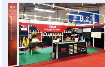
▲ 上图为：2024年3月6日至8日，夜光明参加中国国际纺织面料及辅料博览会标准展位；