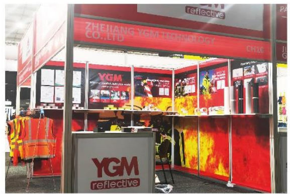
▲ 上图为：2024年06月11日-13日，夜光明参加南非劳保展；