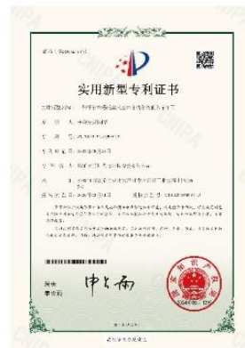
▲ 上图为：2024年03月12日，公司获得一种钢管布卷托盘式立体仓储系统的入库单元的实用新型专利授权，专利号：第20559161号；