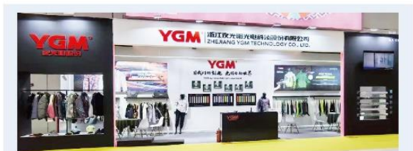
▲ 上图为：2024年3月6日至8日，夜光明参加中国国际纺织面料及辅料博览会精装展会；