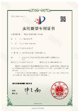
▲ 上图为：2023年02月13日，公司获得一种立体仓储系统的入库结构的实用新型专利授权，专利号：第20478017号；