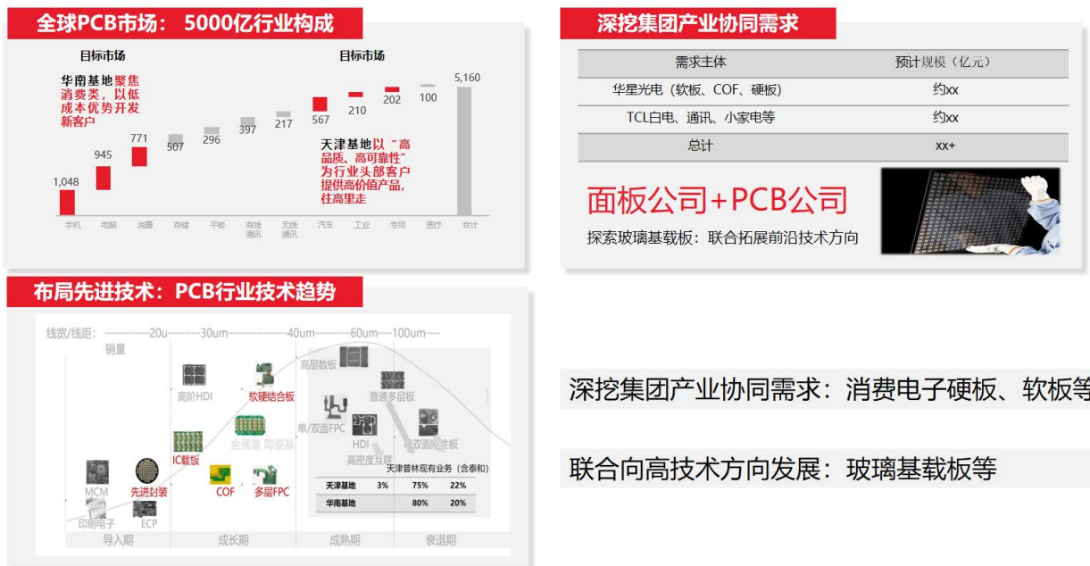
图表：天津普林现有业务和技术发展方向

面板厂作为玻璃基板的多年技术开发者，在这个领域有这先天的优势，台积电日前已经公告买下群创的部分场地，群创是从2017年就投入面板级扇出型封装，以面板产线进行IC封装，采用3.5代线FOPLP玻璃基板开发具备细线宽的中高端半导体封装，半导体制造企业已经开始战略布局这个方向。天津普林立立足于本身天津基地和华南基地两个生产基地，聚焦于不同的类型客户，发展好原有业务的同时，也依靠集团内的资源开展玻璃基载板的业务研发，在这个领域做前沿性的布局，通过技术创新引领公司发展。