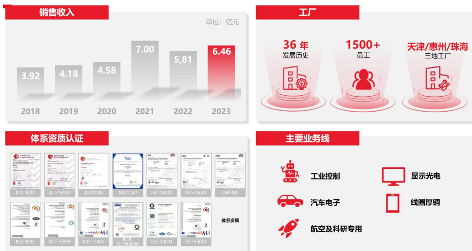
图表：天津普林的资质及工厂情况

随着公司 2023 年完成对泰和电路的收购，公司实现了多工厂多基地的布局；天津基地以工控、汽车、航空及科研专用为主；华南基地（惠州/珠海）以显示光电、线圈厚铜等为主。