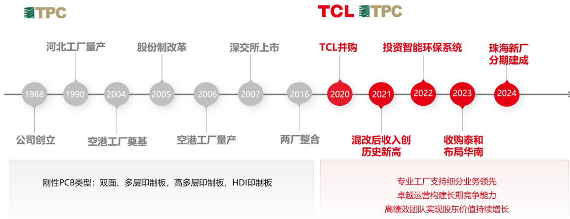
图表：天津普林的发展历程