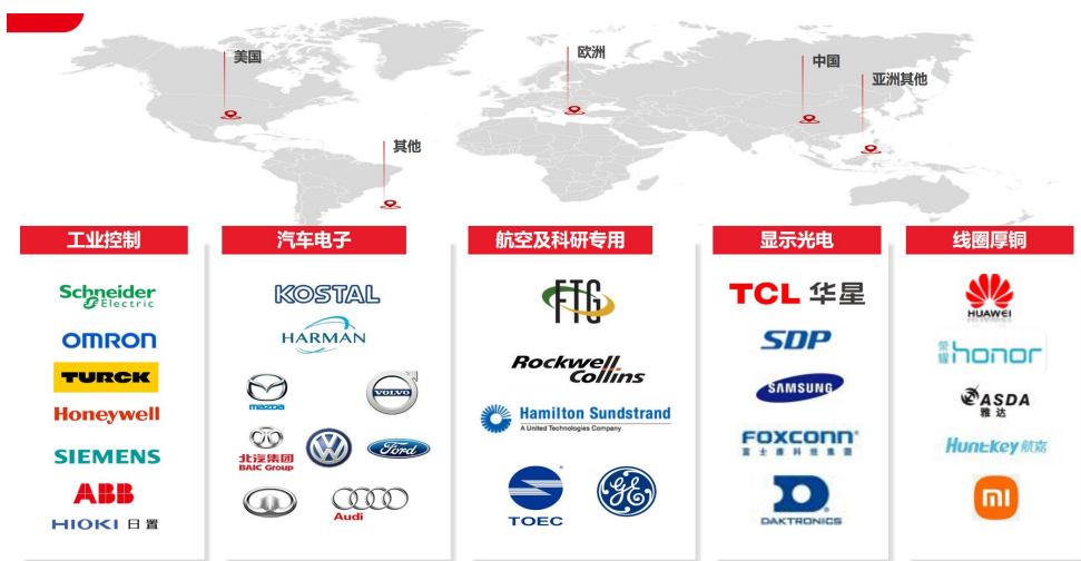
图表：天津普林的分支业务线

公司的业务发展国内和国外齐头并进；其中境内占比70.03%、境外占比29.97%，天津普林的客户分布在全球各主要地区，在显示面板领域，天津普林是华星光电的主要供应商；在工业控制领域，天津普林是施耐德的主要供应商；天津普林通过AS9100质量体系认证、NADCAP技术认证，是国内少有能够给飞机制造商供应关键PCB零部件厂商，通过FTG等合作伙伴先后进入GE通用、中国商飞、ROCKWELL COLLINS等供应链体系，目前产品应用于波音、空客、庞巴迪等国际知名商用飞机，并成功配套国产大飞机项目。