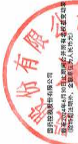
2024年1月1日至2024年4月30日止期间