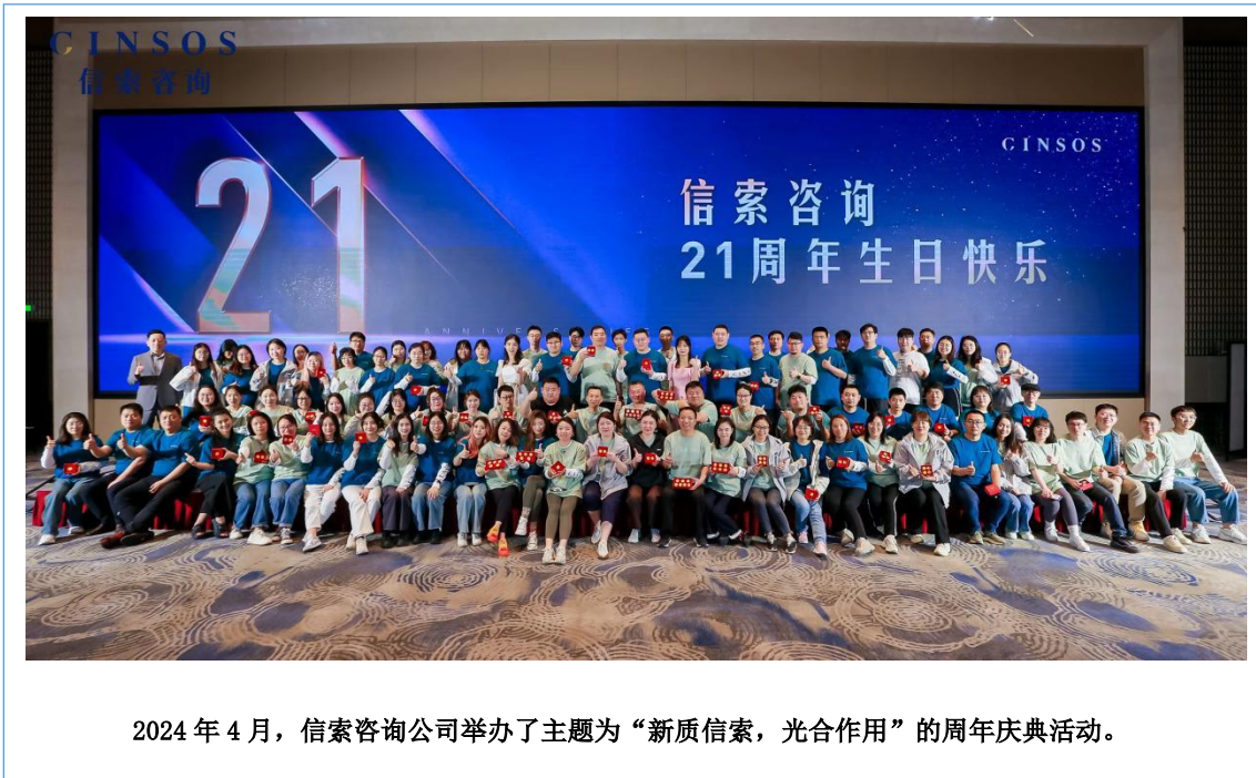
2024年4月，信索咨询公司举办了主题为“新质信索，光合作用”的周年庆典活动。