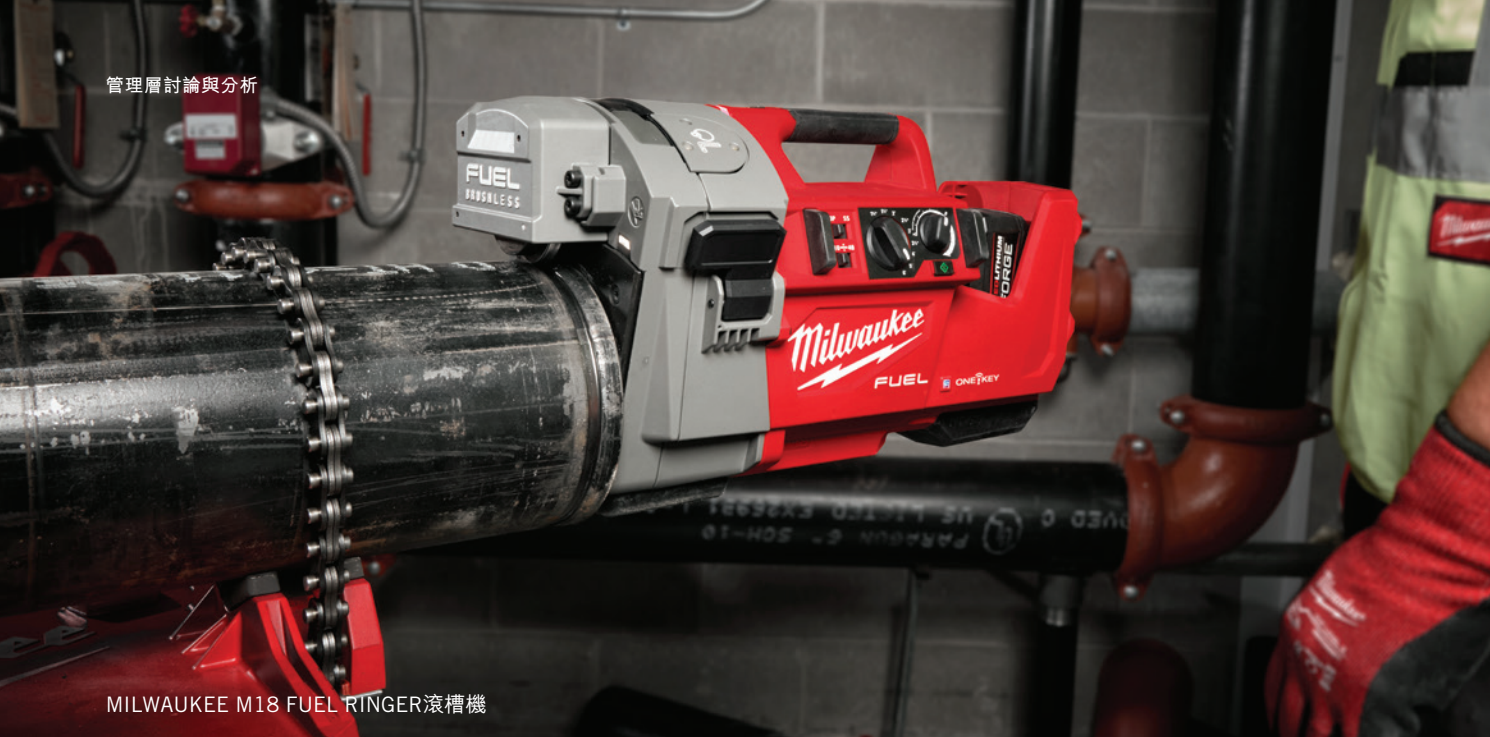
MILWAUKEE M18 FUEL RINGER滾槽機