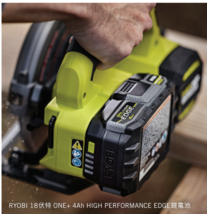
RYOBI 18伏特 ONE+ 4Ah HIGH PERFORMANCE EDGE 鋰電池