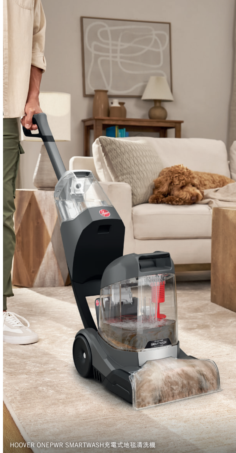
HOOVER ONEPWR SMARTWASH充電式地毯清洗機