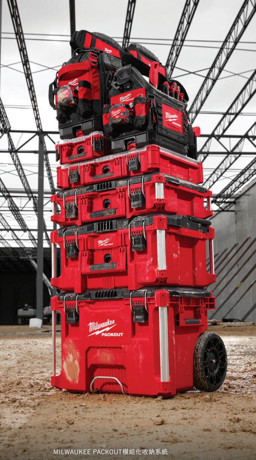
MILWAUKEE PACKOUT 模組化收納系統