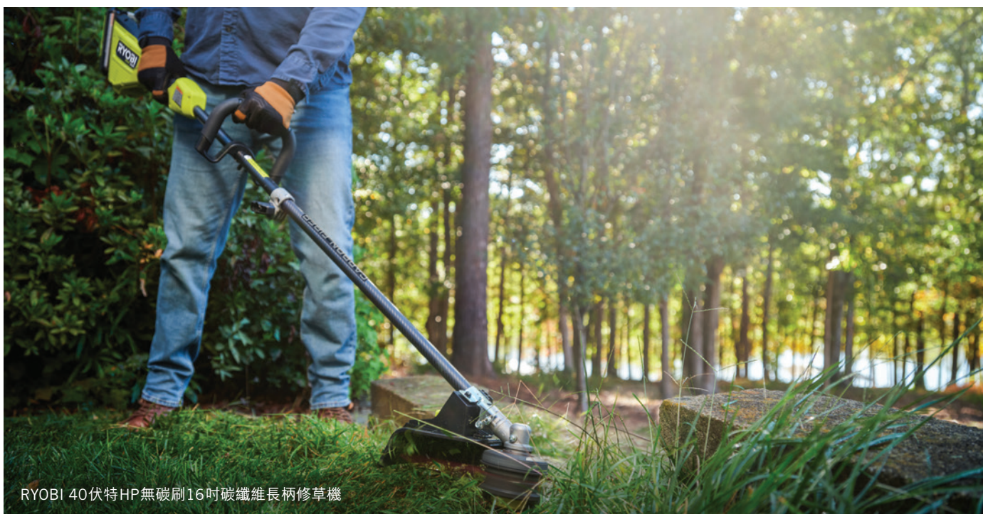
RYOBI 40伏特HP無碳刷16吋碳纖維長柄修草機

我們的策略是吸引新用戶加入我們的充電式電池平台，同時為現有的用戶群增加新產品，進一步擴展我們的平台。自一九九六年推出以來，RYOBI 18伏特ONE+平台至今已提供超過314款兼容產品。我們強大的RYOBI 40伏特系統現有90款產品，而RYOBI USB LITHIUM系統則為用戶提供26款輕巧、便攜的解決方案。