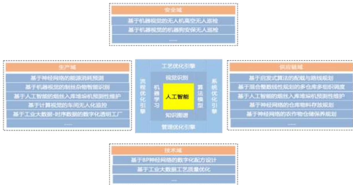
(图 3. 威士顿对人工智能新兴技术的研究与应用)

大数据和人工智能是当代信息技术领域的两个重要工具，它们相互关联，共同推动科技发展和产业创新。如公司的视觉识别无序除杂算法、基于神经网络算法模型的智能烘桶水分控制、基于深度神经网络算法模型的智能烟叶等级识别，以及 AI 设备故障预测模型、水分预测模型、杂质辨识模型等，以及各类基于机器学习的工业机理模型，这些模型算法产品以可行性论证、软件形式，或者嵌入在以机器人为代表的边缘智能装备中成为设备的智能大脑进行交付。通过将大数据、人工智能和机器学习等新兴技术有机地融入公司各个产品和解决方案，让我们的产品成为助力客户从单点智能，向产线智能，最终实现生产制造全面智能的基石。