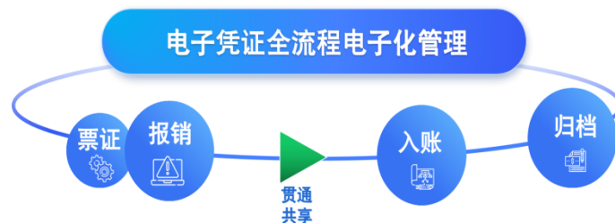
公司电子凭证产品 示意图

电子凭证方面 ，随着电子凭证会计数据标准深化应用、《会计信息化工作规范》及《会计软件基本功能和服务规范》等政策出台，行政事业单位的电子凭证相关业务需求快速增长。公司为行政事业单位提供电子凭证全流程产品，包含电子凭证管理、公务支出报销管理、电子会计档案管理等，并提供与一体化系统共享协同的软件和运营服务，实现单位电子凭证全流程电子化处理，解决电子凭证的接收难、报销难、入账难、归档难等问题，“让数据多跑路，让群众少跑腿”，推动单位会计工作数字化转型。截至报告期末，公司已在内蒙古、黑龙江等省份有案例落地。