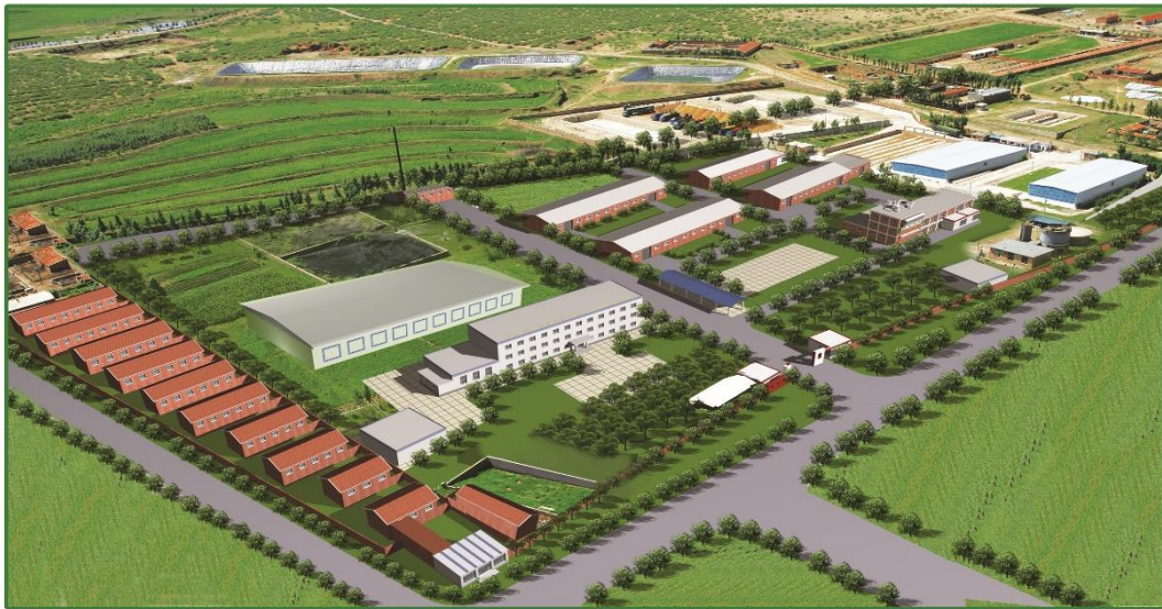
内蒙古华欧淀粉工业股份有限公司鸟瞰图

Inner Mongolia Huaou Starch Industry Co., Ltd