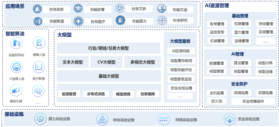
云创数据算法+模型业务体系架构图

公司致力于将大数据、人工智能技术与全产业链体系深度融合，为用户提供算法、模型以及一体机等全方位的解决方案，打造“算法+模型库”的智能成长模式，以算法生成模型，由模型验证算法，实现了算法与模型之间的相互促进和不断优化。公司凭借这一核心优势，开发了具有独特市场竞争力的产品线，不断进行技术积累和业务深耕，为不同行业的客户提供个性化的大数据存储和智能处理解决方案。