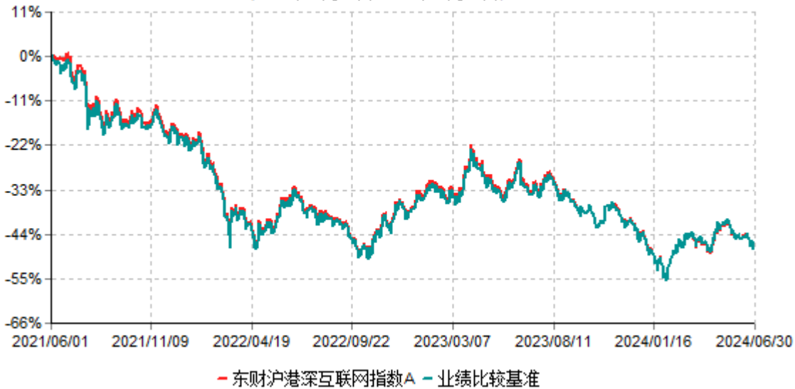
东财沪港深互联网指数A累计净值增长率与业绩比较基准收益率历史走势对比图 (2021年06月01日-2024年06月30日)