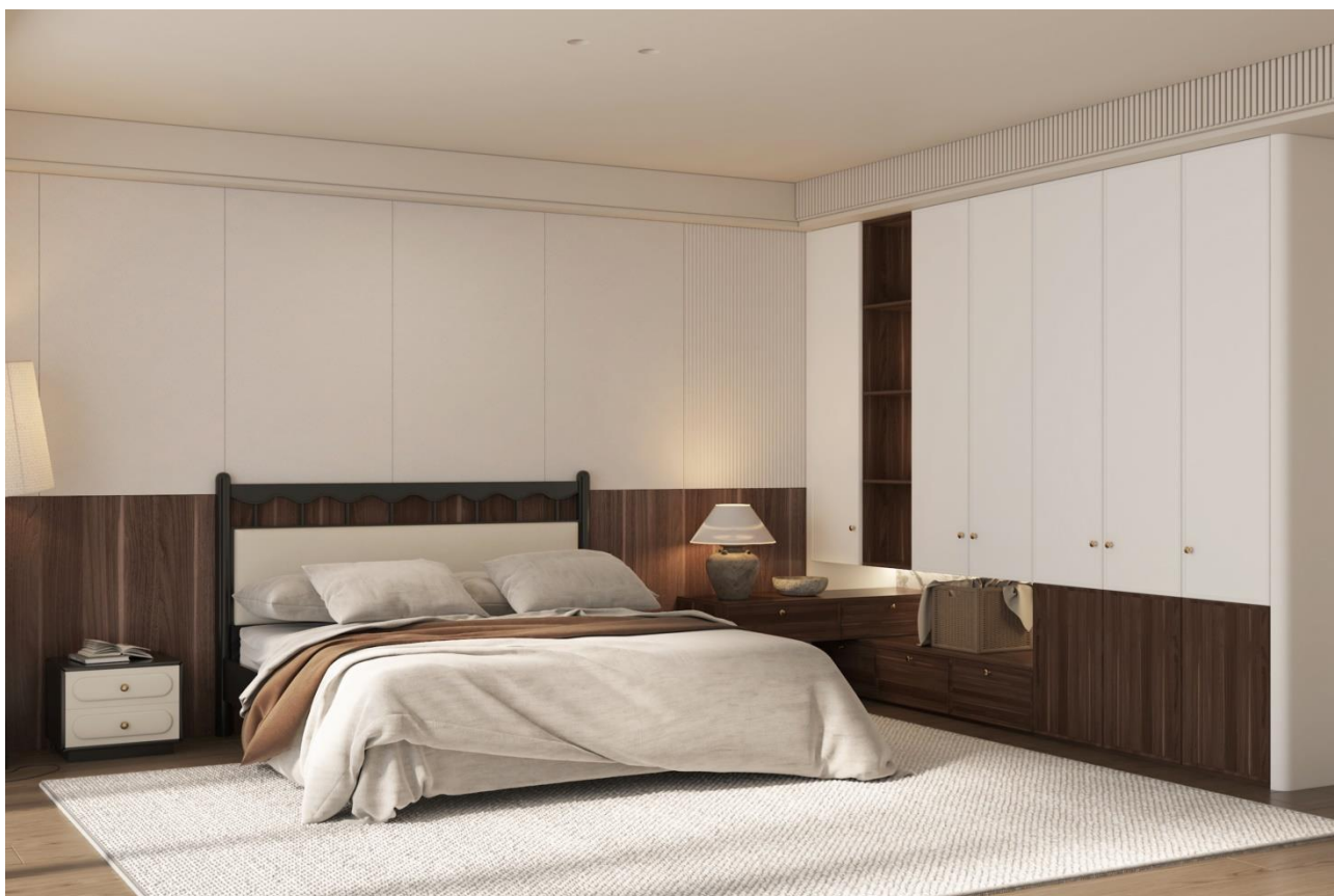
(3) 喷粉新品《迎光》系列