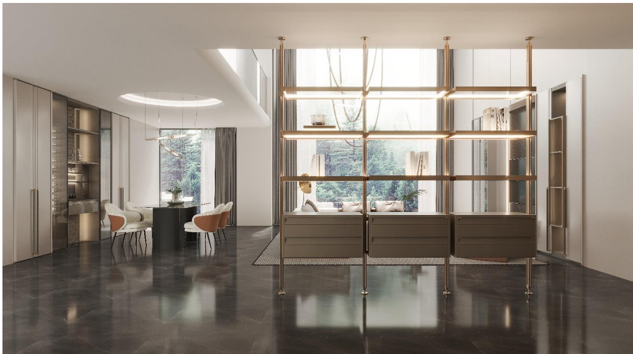
(4) 敏捷线新品-艺术唐璜系列