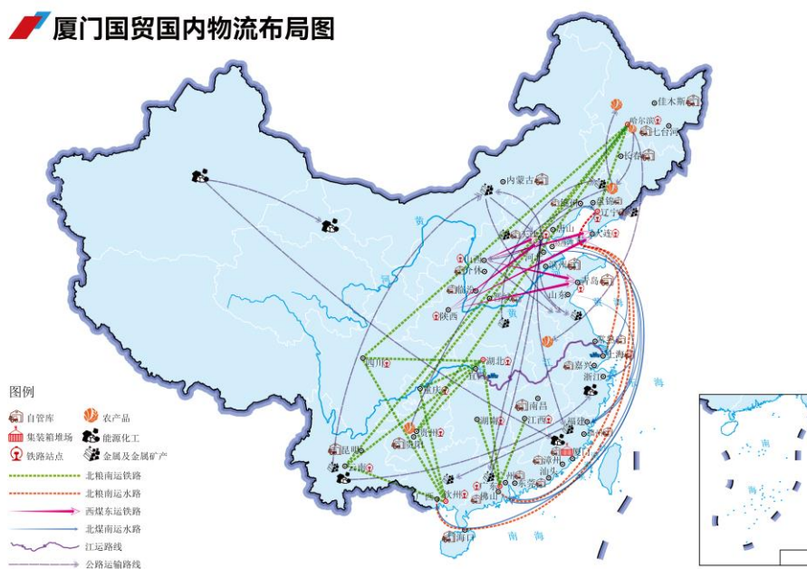
厦门国贸国内物流布局图

公司不断加强物流资源的投资布局，采取轻/重资产相结合，与属地企业合资合作的模式，自管仓库面积 100 余万平方米、合作仓库超 2,500 个，配送平台覆盖国内沿海及内陆主要区域，具有全面的综合运输和配送服务保障能力。公司现自有大型远洋船舶 6 艘、自有运力 45.5 万吨，管理船舶 25 艘、管理运力 157 万吨，年海运运输量超 3,000 万吨；自有 2 艘万吨级江船，自有船和外协船江运年运输量超千万吨。公司在印尼、新加坡、几内亚等地投资布局关键物流核心资产，自有 30 万吨级超大型浮仓 1 艘，经营管理拖轮 15 艘、驳船 18 艘，持续加强国际物流服务能力。