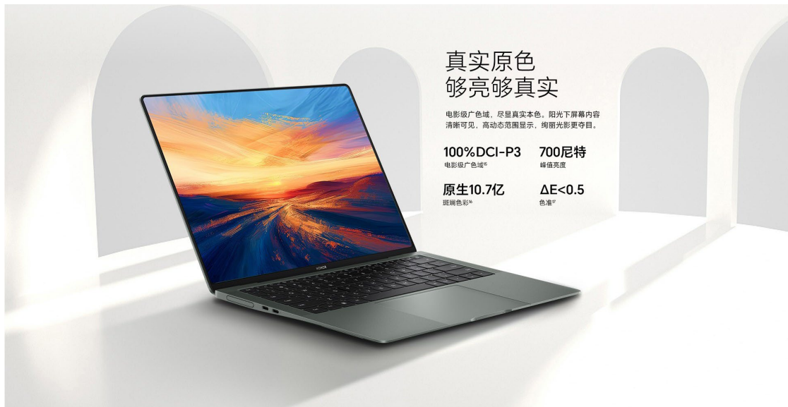
14.6 英寸 3K 120Hz 笔记本电脑显示面板

公司还积极开拓中大尺寸显示新应用领域，自主研发了应用于桌面显示器的国内首款 27 英寸 4K 分辨率高端 AMOLED 面板，积极与海外客户合作开发应用于大飞机上的 AMOLED 显示产品并已实现量产出货，保持了公司在中大尺寸 AMOLED 全领域的持续引领型发展。