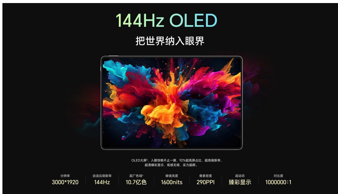
1X. 3 英寸 3K 144Hz 平板电脑显示面板

类, 13"车载类 AMOLED 半导体显示面板产品的量产出货, 上半年出货量同比增长 139%, 继续保持出货量国内第一的领先地位。