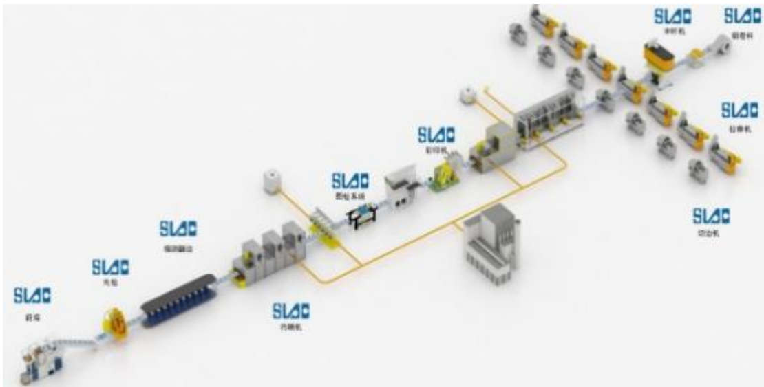
易拉罐高速生产线

易拉罐高速生产设备即将铝材通过多次精密加工工艺生产出易拉罐产品的设备。2015 年以来，公司凭借在易拉盖高速生产线领域积累的技术优势、客户优势，研发并实现销售易拉罐整线生产设备，打破了国外企业在此领域长期垄断的局面。为顺应国内外终端市场对易拉罐产品的消费需求，公司主要研发生产两片罐易拉罐整线设备。相较于传统的三片罐制品，两片罐制品具有密封性好、生产效率高、节省原材料等优势，但对于生产设备的技术要求也更高。目前，公司生产的高速易拉罐生产线的主要设备已经开发成熟，达到了世界先进水平，能够保证生产线的稳定性和良品率。