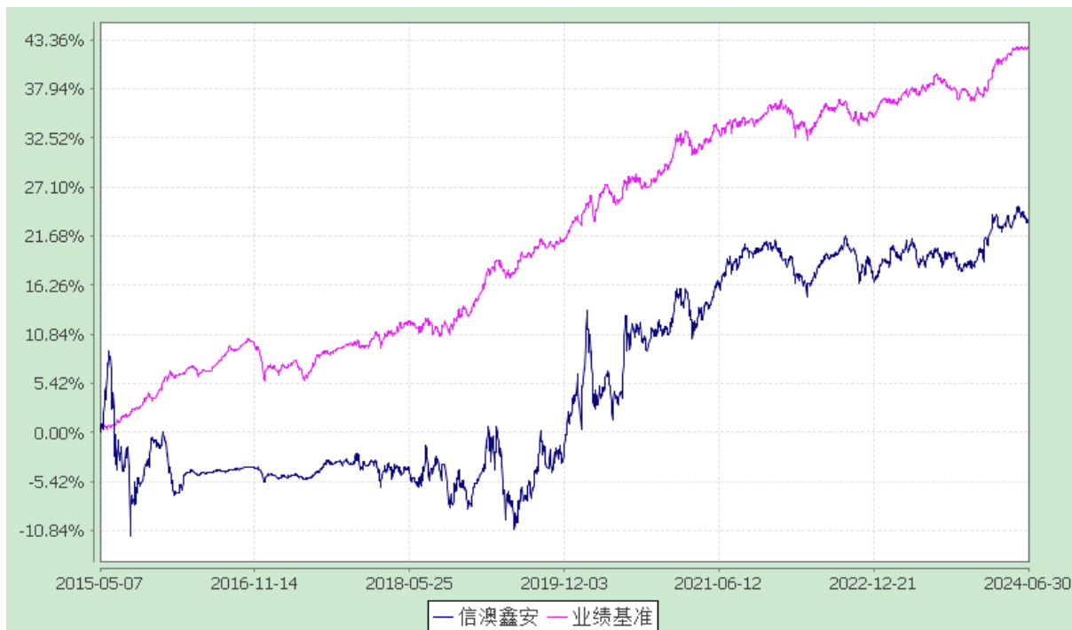
信澳鑫安债券 C 累计净值增长率与业绩比较基准收益率的历史走势对比图