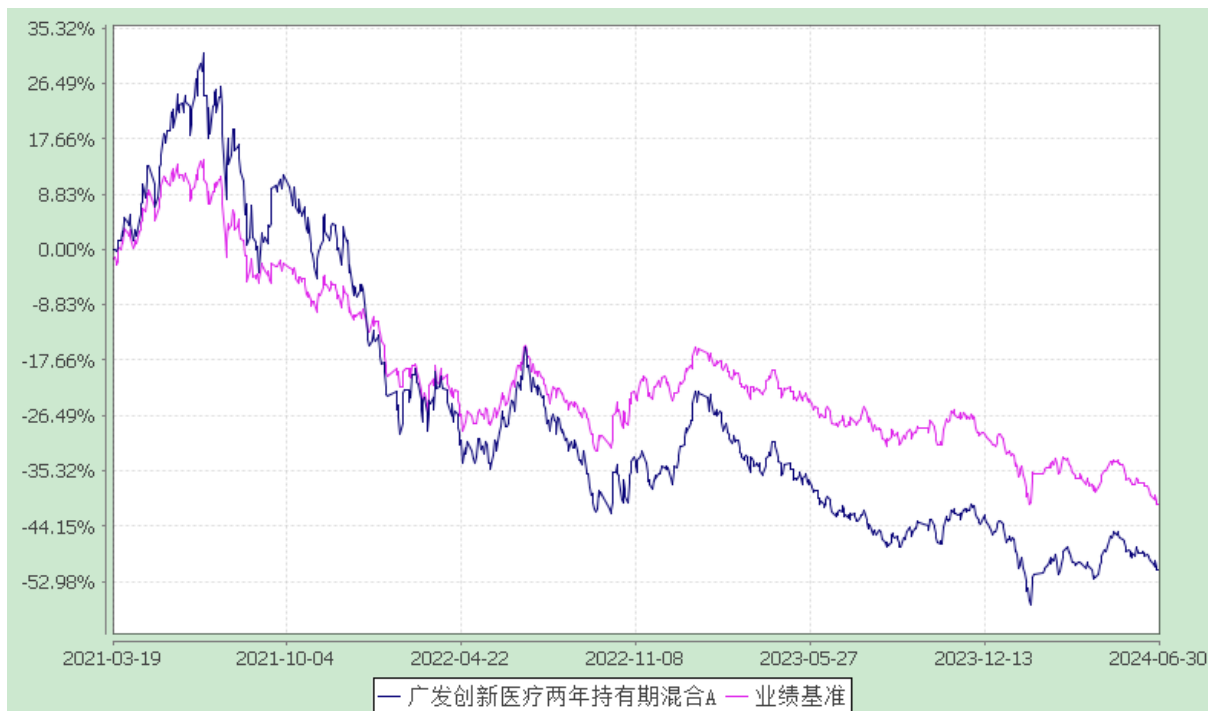
广发创新医疗两年持有期混合 C