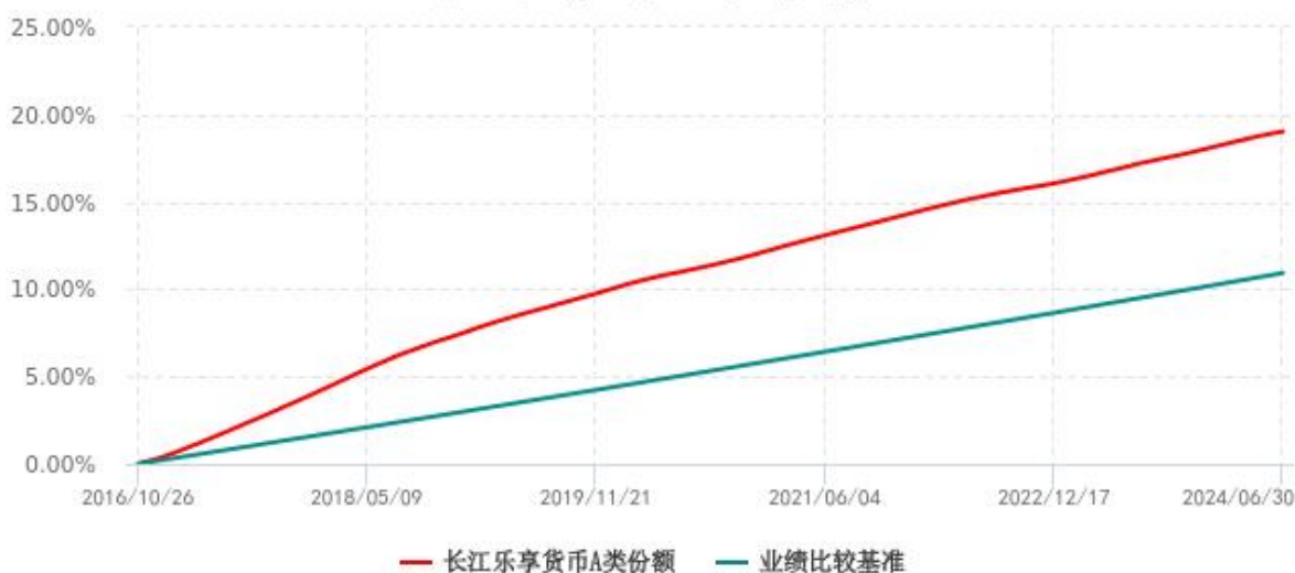
长江乐享货币 A 类份额累计净值收益率与业绩比较基准收益率历史走势对比图 (2016年10月26日-2024年06月30日)