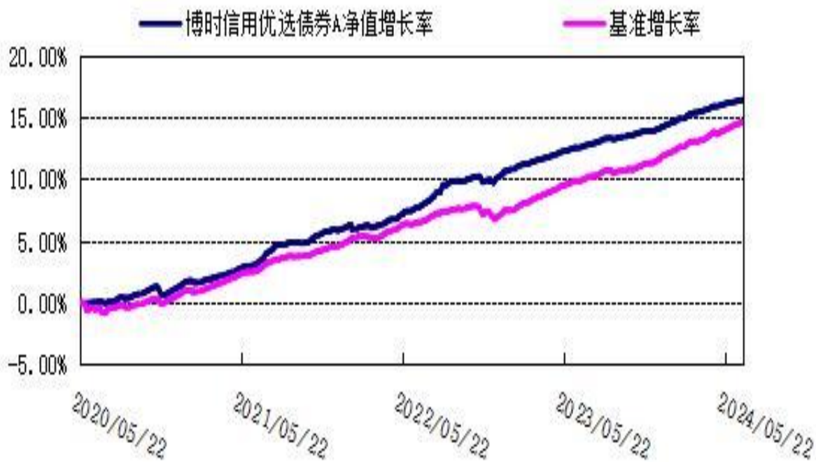
博时信用优选债券 C