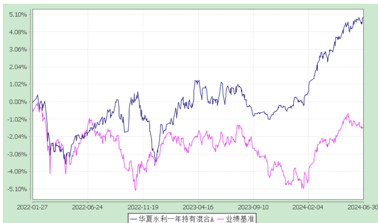
华夏永利一年持有混合 C