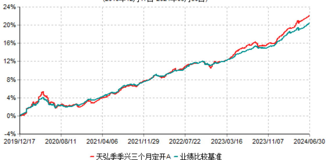
天弘季季兴三个月定开A累计净值增长率与业绩比较基准收益率历史走势对比图 (2019年12月17日-2024年06月30日)